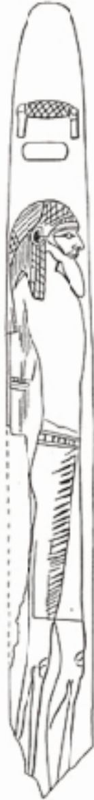
fig. 6 Bâton de Qaâ avec figure d'un ennemi asiatique, d'après W.M.Fl. Petrie, The Royal Tombs of the First Dynasty I , Londres, 1900, pl. XII.

La queue postiche, l'étui pénien ou encore la présence d'une ou de plusieurs plumes sur la tête font partie d'un fonds commun propre aux populations néolithiques de l'Afrique du Nord 36 . Plus encore, les figures rupestres sahariennes montrent principalement l'archer avec l'ensemble de cet équipement. Dans l'iconographie égyptienne, cette image s'est figée dans la figure du soldat archer muni seulement d'un arc et d'une plume sur la tête.