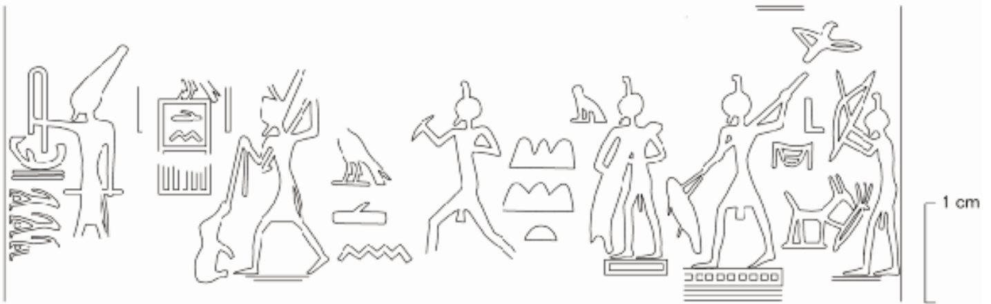
fig. 5 Sceau de Den, nécropole d'Umm el-Qaab, d'après V. Müller, "Seal impressions from Den's tomb at Abydos: new evidence and new interpretations", OLA 260, 2017, p. 793, fig. 4 © DAI, Le Caire.

Un sceau de l'Horus Den, découvert récemment lors des fouilles allemandes dans la nécropole d'Umm el-Qaab à Abydos 14 , montre le souverain en personne pourvu d'une plume sur la tête [fig. 5]. Il la porte en quatre circonstances différentes : lors d'une course rituelle caractéristique de la fête sed , avec l'objet mesken dans la main droite ; lors d'un combat à mains nues avec un hippopotame ; lorsqu'il harponne un grand poisson sorti de l'eau ; enfin lorsque, muni d'un arc, il chasse un oiseau qui vole au-dessus de lui, alors qu'un canidé est pris au piège à ses pieds 15 . Hormis la course rituelle, le roi chasse dans trois milieux différents, aérien, aquatique et terrestre, tandis que la prise à mains nues de l'hippopotame exprime sa force physique et sa capacité à maîtriser les ennemis 16 . Plus encore, la course rituelle qu'effectue ici l'Horus Den reproduit de manière symbolique la réappropriation et le contrôle des territoires d'Égypte. Elle résume les scènes précédentes de chasse et la finalité symbolique qui en résulte, la possession de la terre entière. La plume, attribut du chasseur et du chef guerrier, se trouve portée par le souverain ritualiste à ce moment précis de la fête sed où il concentre les compétences des deux figures.