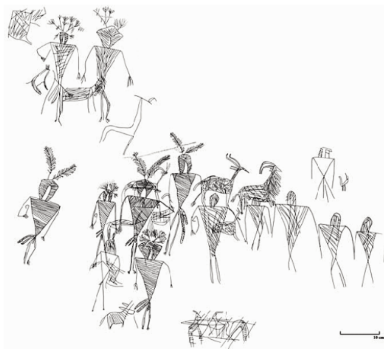
fig. 4 (ci-dessous) Inscription rupestre du Gebel Tjaouti, d'après J.C. Darnell, Theban Desert Road Survey in the Egyptian Western Desert , OIP 119, p. 10.

Enfin, dans la vallée, le manche en ivoire d'un couteau provenant de Hiéaconpolis, daté probablement du règne de l'Horus "Nârmer" 10 , montre cinq individus agenouillés coiffés de deux plumes fichées l'une contre l'autre et, derrière eux, quatre rangées de trois corps décapités 11 . La présence de plumes sur la tête des guerriers agenouillés indiquerait ici aussi un statut social supérieur ou, du moins, une attitude victorieuse face à des ennemis qui ne pourraient garder cet attribut une fois vaincus 12 . Cette convention s'est probablement mise en place après l'unification de l'État égyptien, processus s'accompagnant de l'instauration de codes iconographiques. Ainsi, dans une scène rupestre du Gebel Tjaouti gravée peu avant le règne de "Nârmer", un prisonnier semble avoir conservé sa plume sur la tête alors qu'il est capturé et déjà enchaîné [fig. 4] 13 .