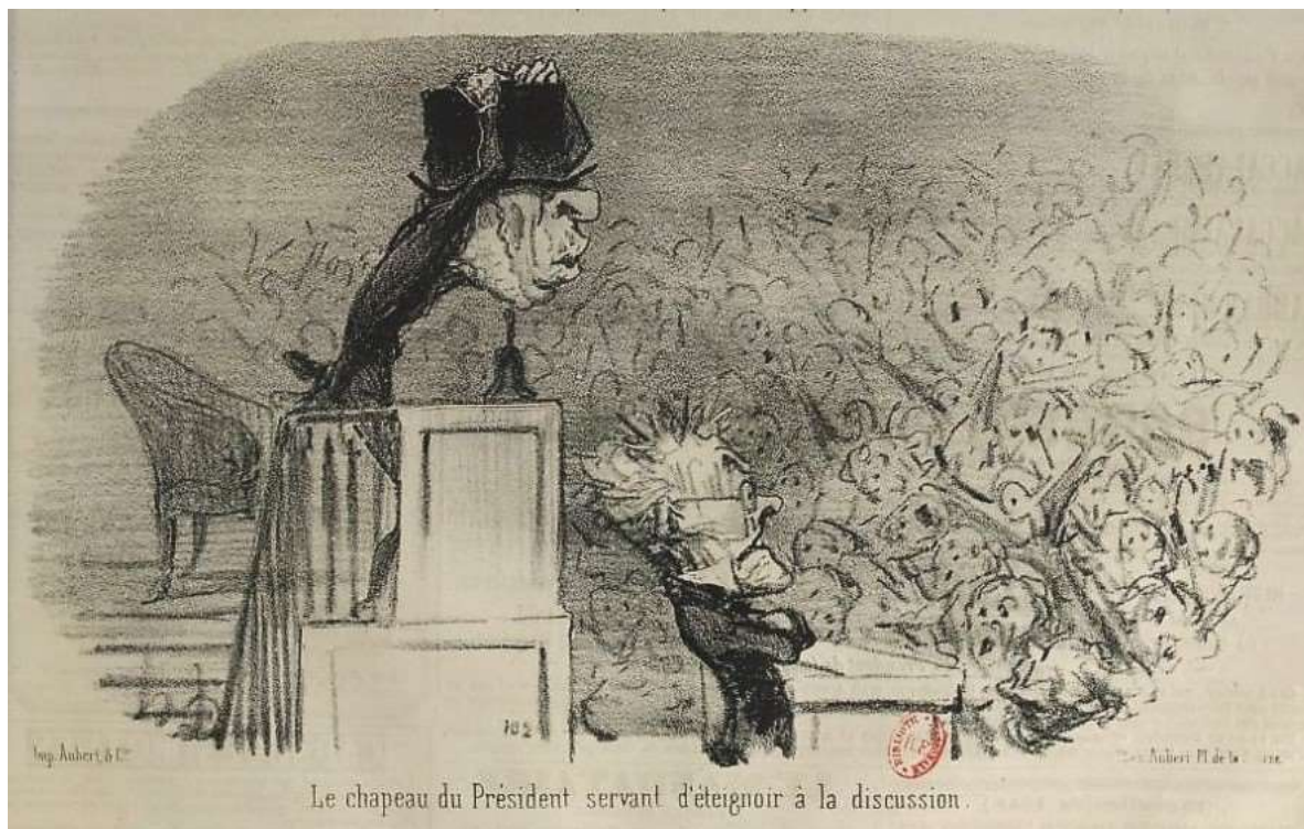
Fig. 1 : Daumier, « Le chapeau du Président servant d'éteignoir à la discussion », Le Charivari , 18 décembre 1849.

Si la presse satirique persifle ce rituel parlementaire dès la monarchie de Juillet 5 , il semble bien que Daumier soit le premier caricaturiste à le représenter sous la Deuxième République dans sa série politique Physionomie de l'Assemblée .