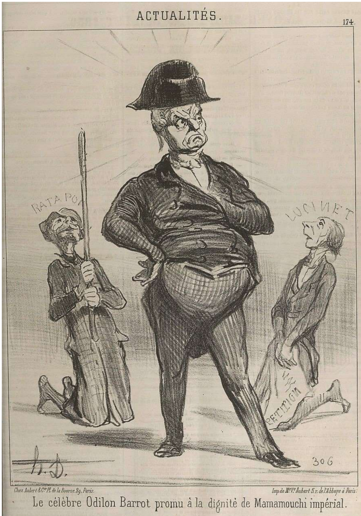
Fig. 5 : Daumier, « Le célèbre Odilon-Barrot promu à la dignité de Mamamouchi impérial », Le Charivari , 28 juillet 1851.