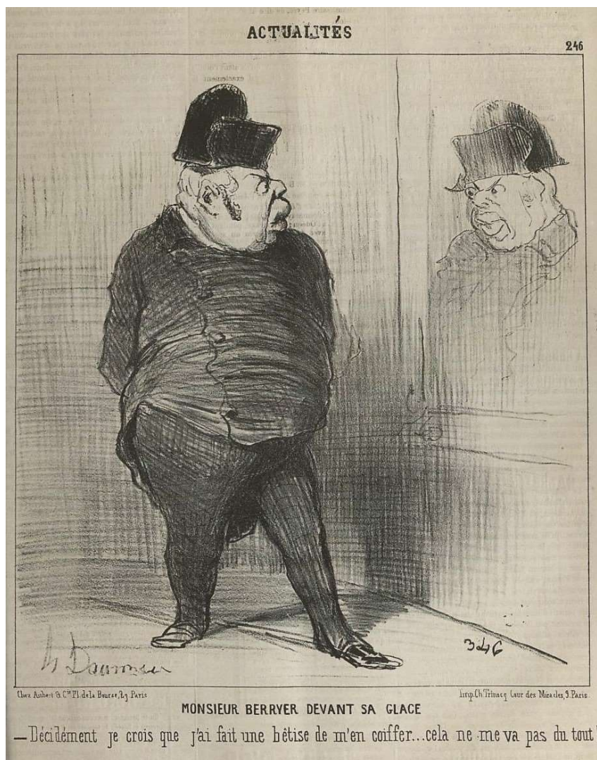
Fig. 6 : Daumier, « Monsieur Berryer devant sa glace. Décidément je crois que j'ai fait une bêtise de m'en coiffer... cela ne me va pas du tout ! », Le Charivari , 8 novembre 1851.

Le 4 novembre précédent, le ministre de l'Intérieur de Thorigny avait lu à l'Assemblée le message annuel du président de la République qui annonçait un projet de loi visant à abroger la loi électorale du 31 mai 1850 ayant restreint le suffrage universel et Berryer s'était prononcé avec succès contre la prise en considération de l'urgence de la discussion 26 . Le jour même de la publication de la caricature, il défendait sa position au sein du 6 e bureau de l'Assemblée : « Il est de l'honneur de l'Assemblée de maintenir la politique dont le Président se sépare aujourd'hui ; elle doit faire respecter le vote du premier corps de l'État » 27 . Le rejet du projet de loi contribue à précipiter le coup d'État perpétré le 2 décembre 1851 qui ouvre la voie au rétablissement de l'Empire un an plus tard. Marianne attendra donc le début des années 1870 pour faire son retour au premier plan, mais avec quelle coiffe 28 ?