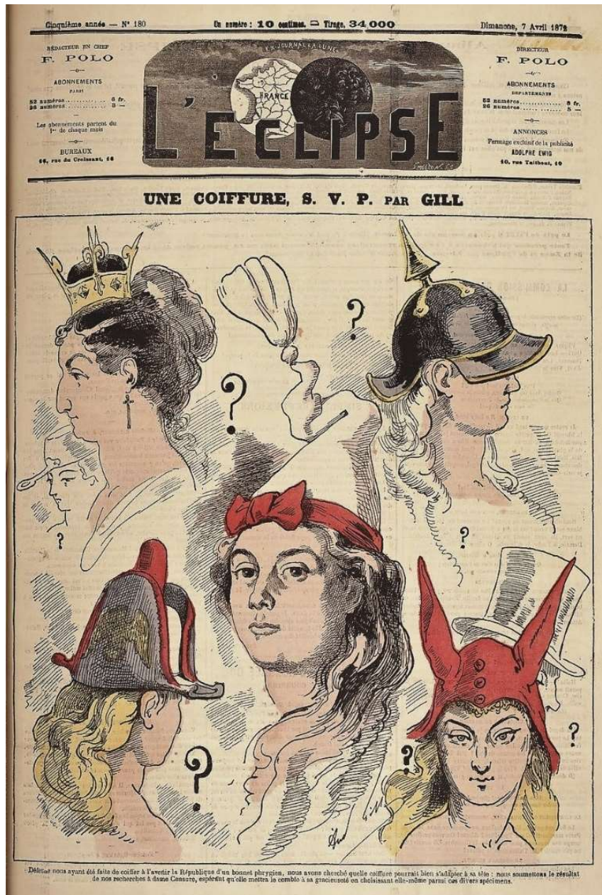
Fig. 7 : Gill, « Une coiffure, S.V.P. », L'Eclipse , n°180, 7 avril 1872

L'ambivalence sur la nature du régime, reflétée par la concurrence des emblèmes politiques, est littéralement questionnée par le républicain André Gill (Louis-Alexandre Gosset de Guines, dit).