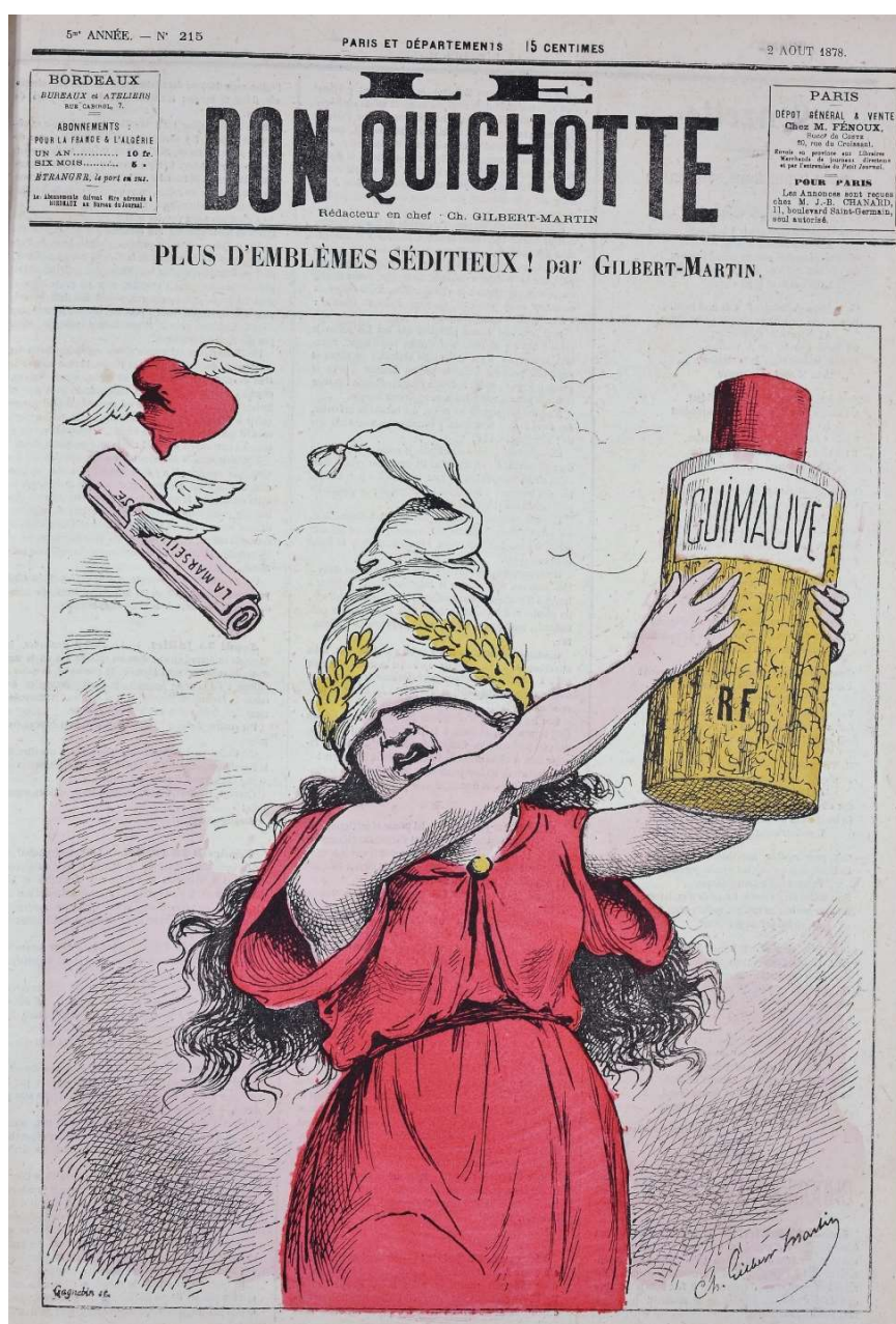
Fig. 9 : Gilbert-Martin, « Plus d'emblèmes séditieux ! », Le Don Quichotte , n°215, 2 août 1878

La portée politique de la crise du 16 mai 1877 scelle la victoire des républicains contre l'ordre moral mais ne lève pas toutes les ambiguïtés, comme en témoigne la place du bonnet phrygien lors de l'Exposition Universelle de 1878. D'une part, il est escamoté au profit de coiffes hybrides dans les œuvres sculptées provisoires de Falguière – Triomphe de la Révolution qui surmonte l'Arc de Triomphe de l'Etoile – et de Clésinger – La République qui accueille les visiteurs de l'Exposition 35 . D'autre part, son exhibition à la hampe des drapeaux tricolores installés aux fenêtres du quotidien La Lanterne lors de la fête nationale le 30 juin vaut au gérant du journal radical d'être poursuivi pour avoir arboré des « emblèmes séditieux, de nature à troubler la paix publique », et condamné à 500 francs d'amende par le jugement de la 9 e Chambre du tribunal de la Seine rendu le 13 juillet 36 .