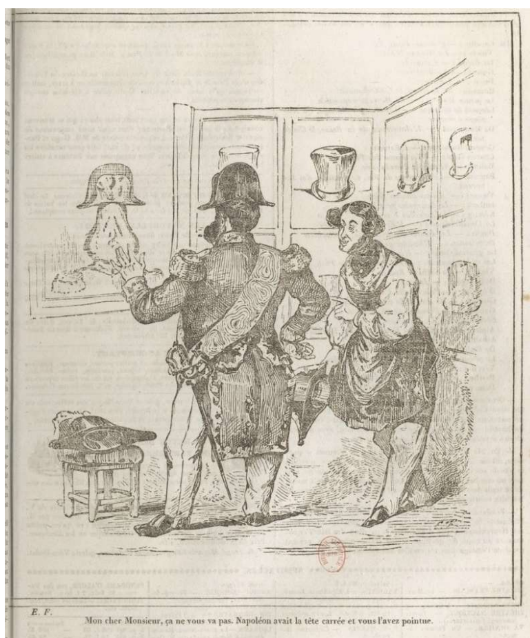
Fig. 4 : Anonyme, « Mon cher Monsieur, ça ne vous va pas. Napoléon avait la tête carrée et vous l'avez pointue », Le Charivari , 3 juin 1834.

L'assimilation du corps de Louis-Philippe à une silhouette en forme de poire est un procédé satirique créé par Charles Philipon au début de la monarchie de Juillet, dont les antécédents comme les développements ultérieurs sont bien balisés 15 . Parmi les déclinaisons de ce répertoire satirique figure l'idée méconnue de coiffer la tête royale piriforme avec un bicorne à la place du haut-de-forme bourgeois associé au « roi-citoyen ». Une lithographie le caricature ainsi en 1834, le tabouret situé à gauche servant de reposoir au chapeau délaissé d'officier de la garde nationale 16 .