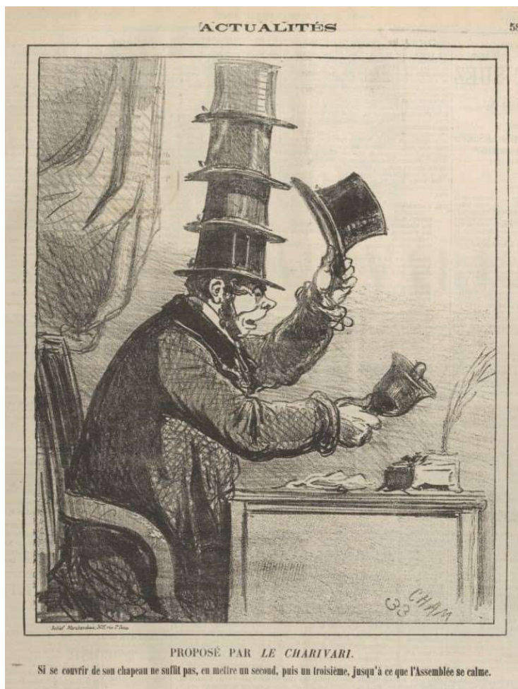
Fig. 3 : Cham, « Proposé par le Charivari. Si se couvrir de son chapeau ne suffit pas, en mettre un second, puis un troisième, jusqu'à ce que l'Assemblée se calme », Le Charivari , 27 mars 1872.

Sur un autre registre, Cham recourt également au chapeau présidentiel pour restituer dans Le Charivari l'année suivante l'agitation parlementaire qui règne toujours à Versailles.