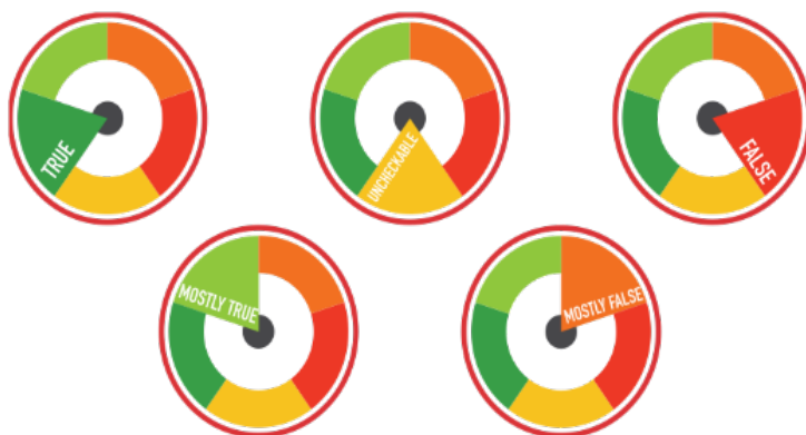
Figure 2. Diagrammes symbolisant le résultat de la vérification sur EUfactcheck.

Un autre point à souligner parmi nos résultats concerne la capacité du dispositif à mettre de l'ordre dans l'information médiatique, participant ainsi à la lutte contre le désordre informationnel (Wardle & Derakhshan, 2017). Le fact-checking procède par accumulation d'éléments qualitatifs qui offrent prise au doute. La méthode proposée par EUfactcheck consiste à ramener ces éléments à une quantité mesurable et objectivée, laquelle exprime un degré de certitude et de doute, qui sont pourtant des appréciations subjectives. À ce degré de certitude et de doute correspondent différentes catégories : « vrai », « plutôt vrai », « faux », « plutôt faux » et « invérifiable ». Une fois le processus de vérification achevé, un article rédigé par le fact-checker présente alors de manière synthétique les éléments de preuve trouvés au cours du processus de vérification, article qui sera publié sur le site web de EUfactcheck destiné au public. Cet article offre au regard du public qui le consulte sur le site web un diagramme circulaire coloré symbolisant la catégorie dans laquelle l'information vérifiée, désormais mise en ordre, est bien rangée, (Fig. 2). C'est en ce premier sens que les informations vérifiées via ce dispositif sont bel et bien "ordonnées", c'est-à-dire rangées dans des catégories.