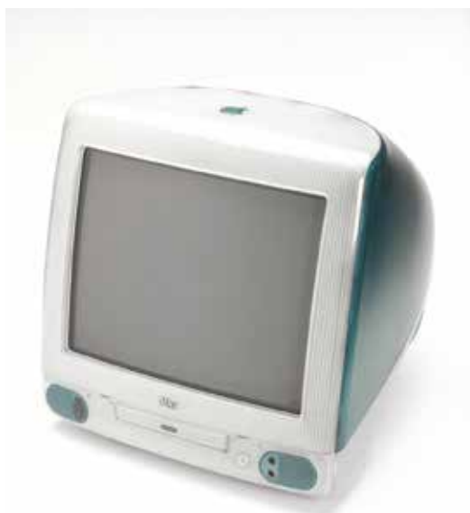
L'IMAC G3 BLEU BONDI (1998-2003) COMBINE DANS UN SEUL ET MÊME BOÎTIER, UN ÉCRAN 15 POUCES ET UNE UNITÉ CENTRALE. SCIENCE MUSEUM GROUP COLLECTION

nous n'avons pas non plus pris en compte les nombreux sites Internet qui recensent patiemment, photos à l'appui, un nombre infini de matériels informatiques, et dont certains se présentent comme des musées : leurs propriétaires, manifestement, ont entrepris leur collection, et ils sont très très nombreux...