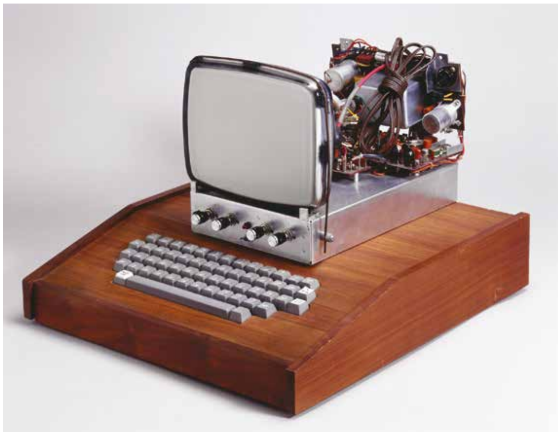
ORDINATEUR PERSONNEL, MODEL APPLE I, CONÇU PAR RON WAYNE, STEVE JOBS ET STEVE WOZNIAK, ET FABRIQUÉ PAR APPLE INC DE 1976 À 1979.