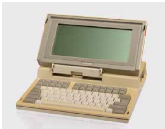
LE T1100, PREMIER ORDINATEUR PORTABLE AU MONDE

En Corée du Sud, le Nexon Computer Museum 30 , ouvert en 2013 sur l'île de Jeju, concentre son propos sur les ordinateurs et les jeux vidéo. L'entreprise a notamment développé en 1996 le premier jeu en ligne, The Kingdom of Winds , symbole du début de l'industrie coréenne du jeu en ligne, dont les participants pouvaient se trouver partout dans le monde. Il est aujourd'hui le plus vieux jeu en ligne massivement multijoueur (MMO en anglais) encore utilisé. Son site internet met en avant la présence dans ses collections d'un des rares Apple I en état de marche, acheté chez Sotheby's en 2012 pour 374 500 dollars ! Il conserve près de 7 000 objets dont des logiciels. Le musée affiche une volonté de démarche scientifique pour rassembler, préserver, et exposer les artefacts numériques historiques, en collaboration avec les chercheurs. Un étage est consacré aux programmes éducatifs et au logiciel libre. Le Nexon Computer Museum travaille en réseau avec d'autres musées consacrés au jeu comme celui de Berlin ou de New York et bénéficie du soutien de sociétés d'édition de jeux vidéo.