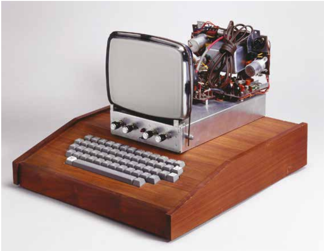
ORDINATEUR PERSONNEL, MODEL APPLE I, CONÇU PAR RON WAYNE, STEVE JOBS ET STEVE WOZNIAK, ET FABRIQUÉ PAR APPLE INC DE 1976 À 1979.

Science Museum / Science and Society Picture Library