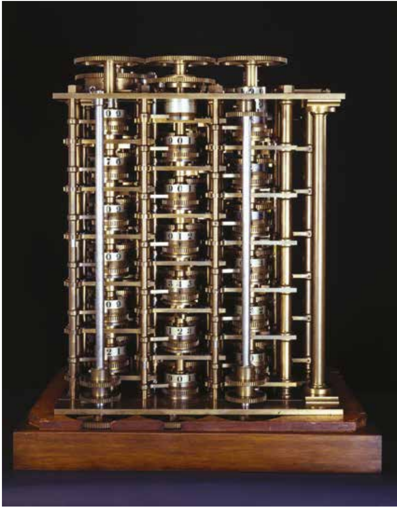
PARTIE DE LA MACHINE À CALCULER DE CHARLES BABBAGE, MACHINE DIFFÉRENTIELLE N°1, 1832, LONDRES

Le musée présente plusieurs ensembles d'artefacts autour des machines Burroughs du XIX e siècle avec leur emballage d'époque, permettant d'admirer la perfection de leurs mécanismes d'impression, dans le contexte d'un atelier bancaire, de même qu'un atelier mécanographique des années 1950. Si cette réalisation est exemplaire par la démarche des acteurs en présence et la qualité des collections, sa pérennité reste fragile : le NAM-IP peine non seulement à obtenir des subventions publiques mais aussi la légitime « reconnaissance muséale de catégorie B » nécessaire pour voir ces aides augmenter 18 .