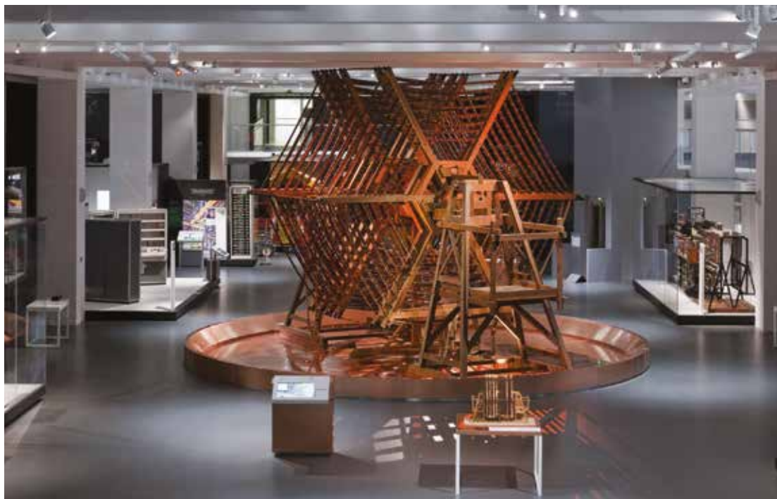
INDUCTEUR DE RÉGLAGE AÉRIEN DE L'ÉMETTEUR TRÈS BASSE FRÉQUENCE (16 KHZ) INSTALLÉ À LA STATION RADIO RUGBY, CONSTRUCTEUR INCONNU, BRITANNIQUE, 1943-1966

son inauguration, le 24 octobre 2014, la Reine Elizabeth II, venue en personne, a envoyé son premier tweet 23 : « It is a pleasure to open the Information Age exhibition today at the @ScienceMuseum and I hope people will enjoy visiting ».