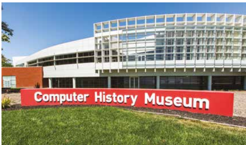
VUE EXTERIEURE DU COMPUTER HISTORY MUSEUM (USA) Doug Fairbairn

Le plus important musée au monde dans le domaine informatique est actuellement le Computer History Museum aux États-Unis 11 . Émanation du musée de Boston, et d'abord appelé Computer Museum History Center (CHM), il est installé en 1996 sur la base navale de la baie de San Francisco. Rebaptisé Computer History Museum (CHM) en 2000, il déménage, en 2002, à Mountain View au milieu de la Silicon Valley, dans les anciens locaux historiques de la société Silicon Graphics . Très soutenu par les industriels du secteur - il est à deux pas de Google et de Microsoft -, il prend très vite le pas sur le musée historique de Boston, et récupère une partie de ses collections lorsque ce dernier ferme. Le parcours d'exposition, d'environ 12 000 m 2 , est articulée au travers d'une vingtaine de salles qui compose un parcours par période et par domaine. Après sa rénovation de 2010-2011, la nouvelle exposition, intitulée « Révolution : les premiers 2000 ans de l'informatique », offre à comprendre la naissance des ordinateurs, du boulier au smartphone. Cette histoire des techniques est complétée par celles des hommes et des femmes qui en