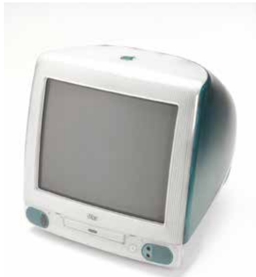
L'IMAC G3 BLEU BONDI (1998-2003) COMBINE DANS UN SEUL ET MÊME BOÎTIER, UN ÉCRAN 15 POUCES ET UNE UNITÉ CENTRALE.

nous n'avons pas non plus pris en compte les nombreux sites Internet qui recensent patiemment, photos à l'appui, un nombre infini de matériels informatiques, et dont certains se présentent comme des musées : leurs propriétaires, manifestement, ont entrepris leur collection, et ils sont très très nombreux...