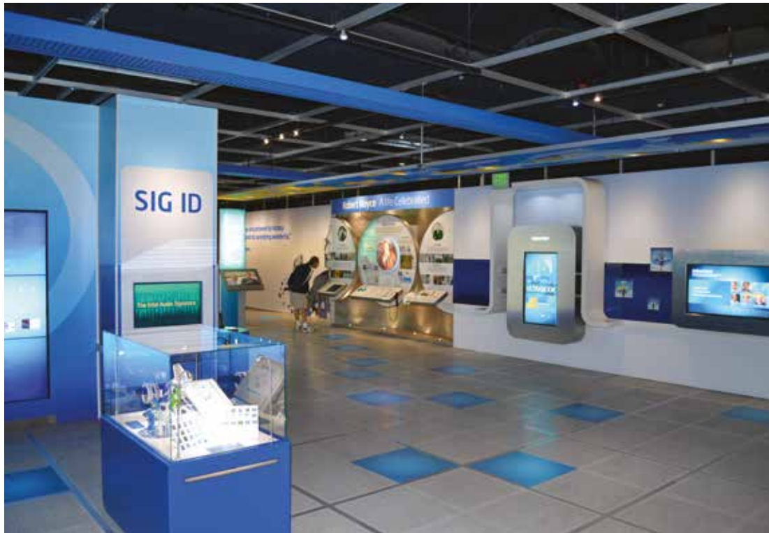
VUE INTÉRIEURE DU MUSÉE INTEL