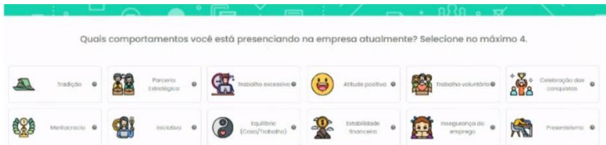
Imagem 2: Pergunta e resposta sobre avaliação do comportamento da equipe.