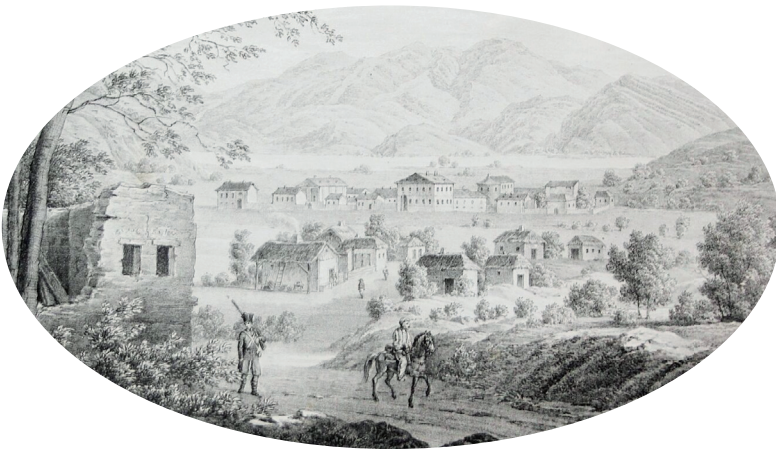
Ill. 2. Kunike, Adolf Friedrich (d'après L. Erminy), Contumaz Schubanek bey Alt-Orsova / vue de la région d'Orșova (aujourd'hui Jupalnic en Roumanie), lithographie, 1824 (détail).

communautés villageoises. Singeant le vocabulaire et les pratiques des diètes provinciales, les chefs de cantons cherchent à s'imposer comme un corps représentatif, une « nation du pays » appelée à co-gouverner la province. Laminée par la liquidation générale des privilèges dans les années 1770, ces prétentions politiques font long feu. Certains notables se réfugient dans une stratégie d'ascension sociale individuelle et intègrent la noblesse du royaume de Hongrie. D'autres nourrissent la contestation en se muant en entrepreneurs identitaires et défendent la référence à un âge d'or des « nations privilégiées » sous protection impériale (cinquième partie).