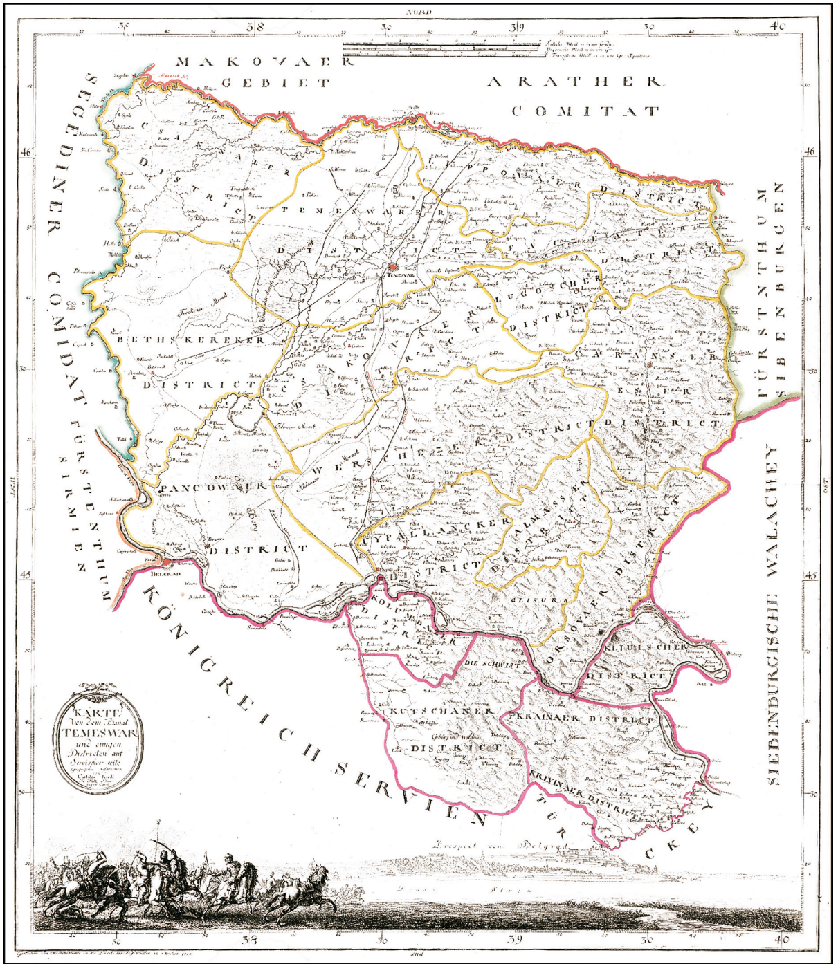
Ill. 1. Castulus von Reidl, Karte von dem Banat Temeswar , Munich, 1789 (coll. part.). Cette carte, éditée en 1789, représente la situation du Banat en 1720.