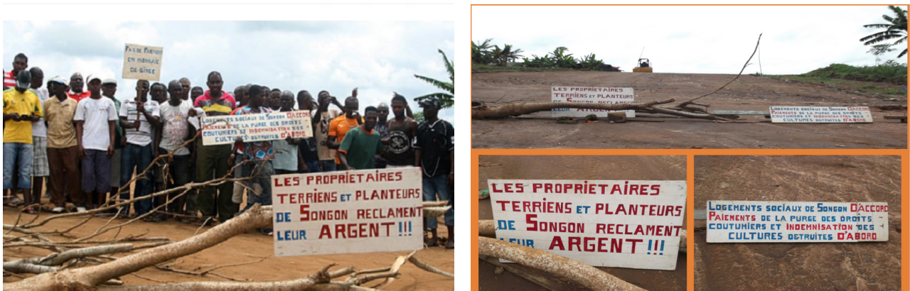
Figure 3 (droite). Barricade érigée à l'entrée du site de construction lors d'un mouvement de protestation (A. M. Koffi-Didia, Songon Kassemblé, mai 2015)