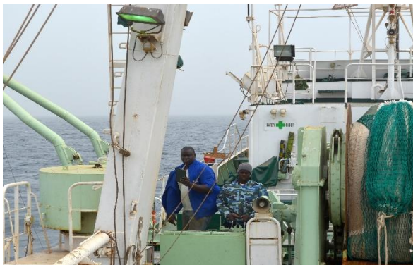
Photo 1 : Navire de recherches halieutiques, ITAF DEME du CRODT de l'ISRA.

Compte tenu de la pression de pêche importante subie par la sardinelle ronde, les gestionnaires des pêches ont cherché à modéliser les séries chronologiques des prises comparées à la densité, au recrutement ou à la production (Baldé 2019). En effet, appliquer ces indicateurs (ex. indices d'abondances) à des stocks tels que la sardinelle ronde pour démontrer leur utilité et permettre aux acteurs de la pêche (p.ex. pêcheurs, gérants de supermarchés, consommateurs et politiciens) de participer à la gestion des pêches et de renverser le schéma mondial de la surpêche (Baldé 2019).