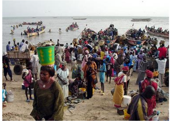
Photo 3 : Débarquements de la flotte artisanale sur les côtes sénégalaises.

Le Cobo (ethmalose) est principalement exploitée par les pêcheries artisanales en Gambie, au Sénégal et récemment en Mauritanie. Elle est surtout pêchée au moyen de la senne tournante en Mauritanie, et de filets maillants encerclant au Sénégal et en Gambie. Les captures de l'ethmalose au Sénégal ont légèrement fluctué, mais ont chuté à partir de 2010 d'environ 45 % en 2011 et 34 % en 2012 avant de remonter en 2013 et 2014 (79 %). Au Sénégal, l'effort de pêche des filets maillants encerclant est passé de 22 553 sorties en 2013 à 30 513 sorties en 2014 soit une hausse de 35 % (Baldé et collaborateurs, 2018). La production, surtout le long de la Petite Côte du Sénégal (Mbour et Joal), est stimulée par l'existence du marché sous régional et l'implantation d'usines de production de farine de poisson.