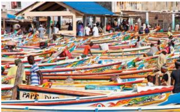
Photo 2 : Flottes artisanales au Sénégal.