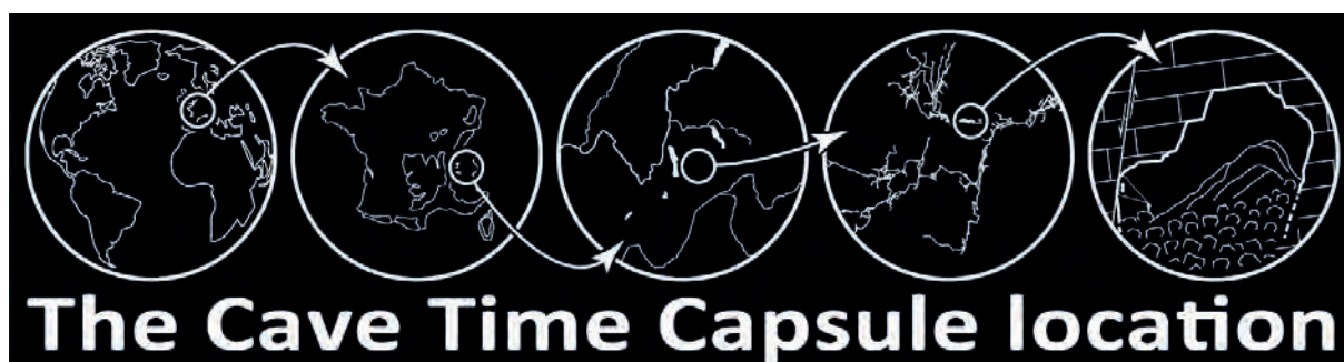
Figure 2 : Localisation de la capsule temporelle dans la salle Fitoja. Visual servant à la communication autour du projet.

Il s'agira de créer un caisson, résistant, esthétique, durable et d'y glisser un certain nombre d'objets qui signent la spéléologie de notre temps, puis de descendre ce caisson dans une grotte prestigieuse de Savoie. La suite appartient à nos petits-enfants. Dans 69 ans, ils ouvriront cette capsule et décrypteront les messages que nous y aurons enfouis. Quelle émotion ressentiront-ils alors, en 2091, en découvrant ces objets que nous aurons enterrés en 2022 ? Quel choix allons-nous faire aujourd'hui quant aux objets spéléologiques que nous allons livrer au futur ? C'est un projet du présent, le nôtre, celui de laisser un cadeau. C'est un projet du futur, le leur, celui de découvrir ce cadeau.