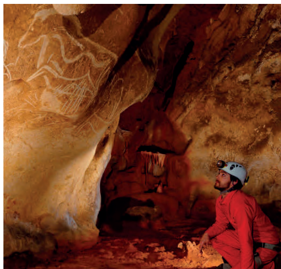
Figure 1 : Les œuvres pariétales de la Préhistoire nous laissent aussi un message à décrypter par-delà le temps, mais nous ne pouvons pas être sûrs que ces lointains artistes aient prévu de s'adresser à nous. Ainsi la grotte Chauvet, ornée il y a plus de 36.000 ans, brutalement fermée par un écoulement il y a plus de 21.000 ans et rouverte en 1994, constitue-t-elle de fait une capsule temporelle, même si telle n'était pas l'intention initiale.

C'est assez connu, les grottes offrent des conditions de préservation particulièrement exceptionnelles. Des stalagmites enregistrent les climats anciens, des formes d'érosion enregistrent le passage d'une rivière souterraine.