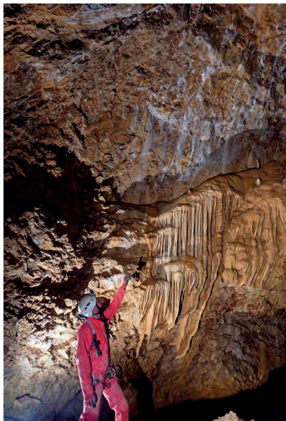
Figure 3 : La paroi de la salle Fitoja, retenue pour l'implantation de la capsule temporelle : un plan de faille lisse qui marque lui-même une temporalité de l'évolution géologique du site, celle des phases tectoniques alpines bien avant les phases de karstification. Entre géologie, karstification et présence humaine, le site se construit par l'accumulation de différents repères temporels.

Passer par Fitoja Express implique aujourd'hui une descente de 180 m de dénivellation et le franchissement de plusieurs rétrécissements et de quelques puits, dont un d'une quarantaine de mètres de hauteur. Des tests de passage de bidons plus ou moins larges nous ont permis de fixer le diamètre maximal possible pour la capsule : 300 mm.