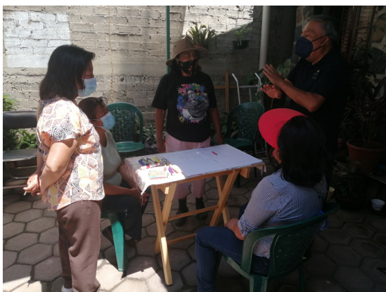
Figures 1 & 2. Processus de production et de restitution collective des cartes mentales (Ducharme, juin 2022)

Le contexte social et spatial de San Gregorio a été particulièrement favorable à l'implémentation de ces ateliers. La dynamique a bénéficié notamment de la présence d'habitant·es porteur·es de revendications à base territoriale et du maintien d'un certain « esprit de village », que les habitant·es opposent à la « périphérisation » de San Gregorio et aux dynamiques métropolitaines jugées déprédatrices.