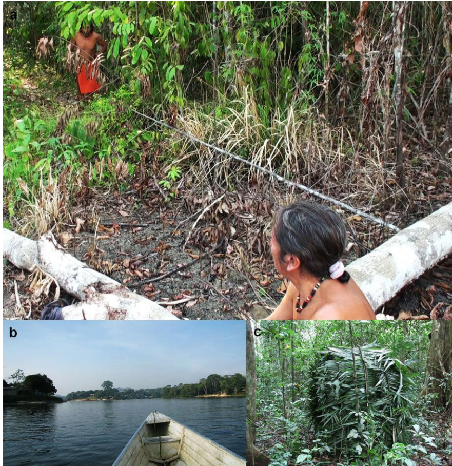
Figure 2 : Exemples de contextes d'usage de la parole sifflée et des imitations animales. a. Siffleurs Wayãpi utilisant la technique bilabiale pour communiquer à une distance relativement courte (Camopi, Oyapock), b. Exemple de paysage rencontré dans un village au bord du fleuve Oyapock, c. Exemple de petit abri en feuilles de palmier (adapté de Meyer (2015)).

car il peut arriver qu'un prédateur des espèces imitées soit leurré également et attaque à son tour, comme c'est souvent le cas de l'ocelot (cf. minute 5 du court métrage animé associé à cet article, où cette scène a lieu avec un hocco alector ( Crax alector )).