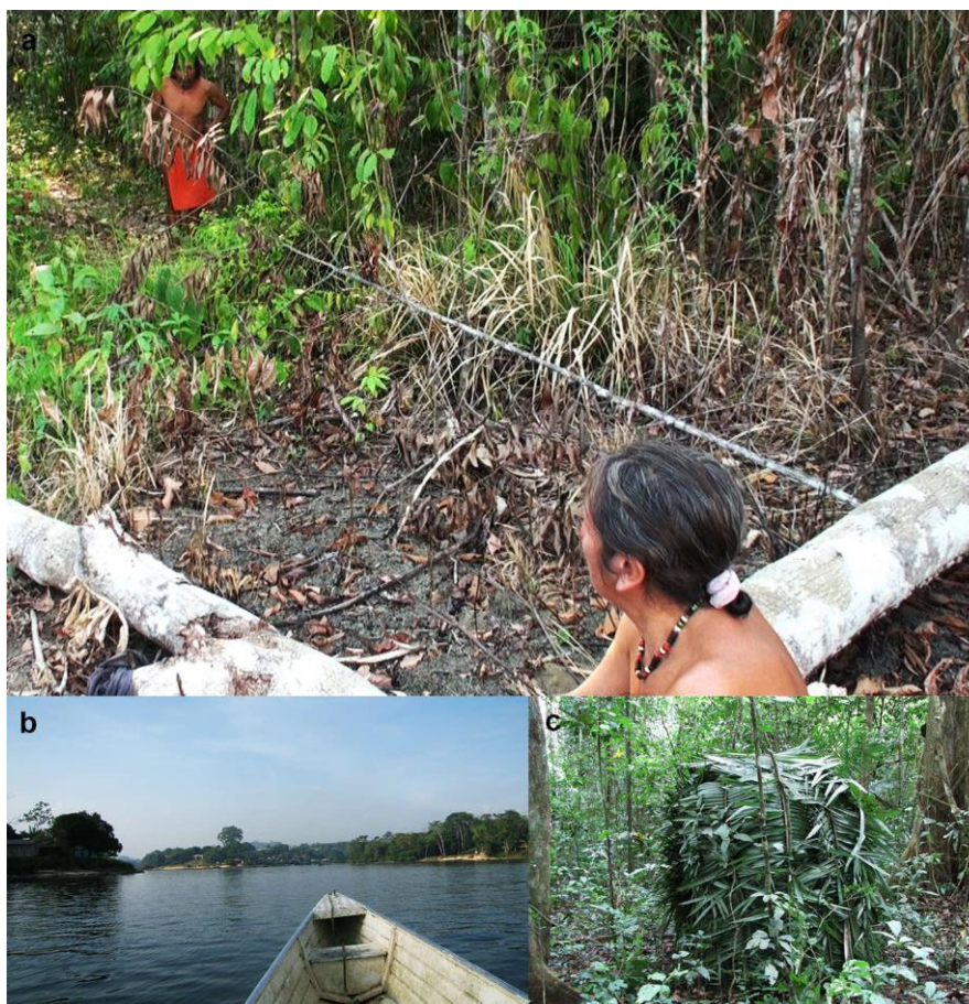
Figure 2 : Exemples de contextes d'usage de la parole sifflée et des imitations animales. a. Siffleurs Wayãpi utilisant la technique bilabiale pour communiquer à une distance relativement courte (Camopi, Oyapock), b. Exemple de paysage rencontré dans un village au bord du fleuve Oyapock, c. Exemple de petit abri en feuilles de palmier (adapté de Meyer (2015)).

car il peut arriver qu'un prédateur des espèces imitées soit leurré également et attaque à son tour, comme c'est souvent le cas de l'ocelot (cf. minute 5 du court métrage animé associé à cet article, où cette scène a lieu avec un hocco alector ( Crax alector )).