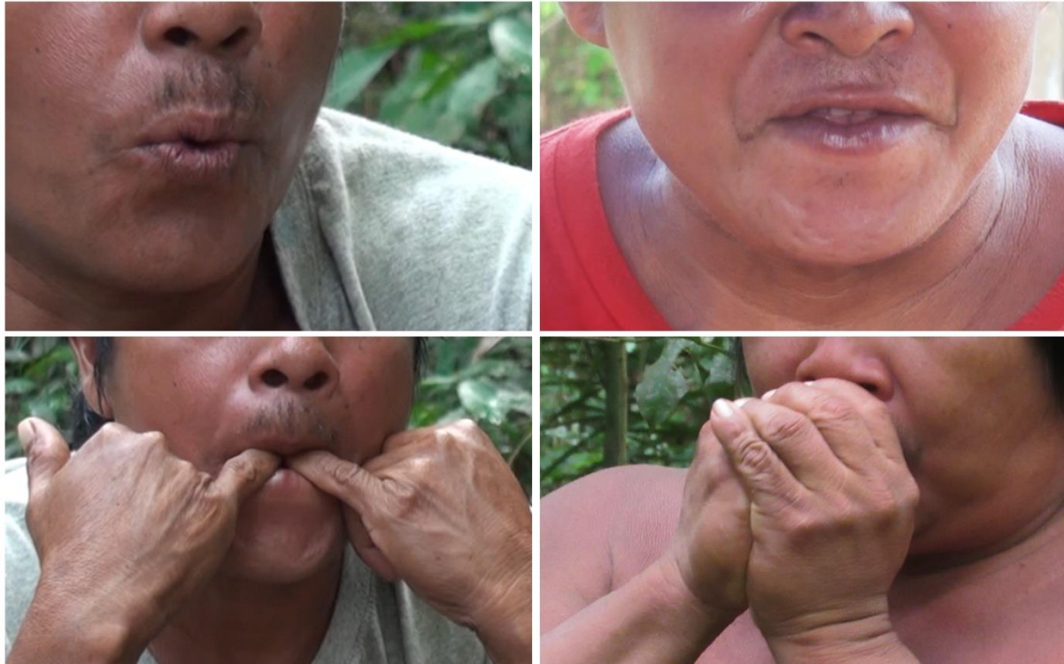
Figure 1 : Différentes techniques de sifflement présentées par trois siffleurs wayãpi. Ces différentes techniques sont utilisées pour imiter acoustiquement différentes espèces animales. Toutes servent également à parler en sifflant dans des situations un peu différentes. La protrusion bilabiale (en haut à gauche) est la plus commune car c'est aussi la plus adaptable (la puissance de sifflement est assez modulable, allant du sifflement discret, presque chuchoté à des sifflements relativement puissants). Elle sert pour s'appeler ou se saluer sur le fleuve, dans le village ou en forêt. Elle est aussi pratique car moins susceptible d'effrayer les animaux lors de la chasse. La technique de résonance dans les mains (en bas à droite) est également discrète en forêt et produit un sifflement plus puissant que la technique bilabiale mais de fréquences plus graves. Les deux autres techniques, la linguo-dentale (en haut à droite) et la technique avec insertion d'un ou deux doigts dans la bouche, permettent de couvrir de plus grandes distances