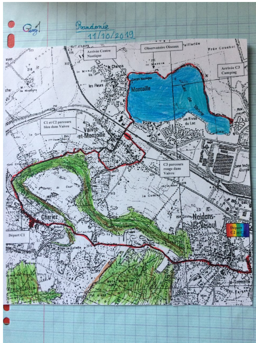
Figures 1 & 2. Extrait des deux premières leçons du classeur de géographie de Sasha (CM1)