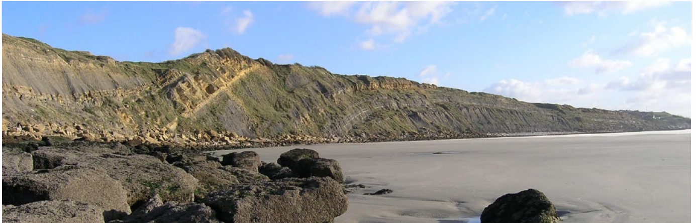
Anticlinal de la Crèche dans les dépôts du Jurassique supérieur au nord de Boulogne-sur-Mer