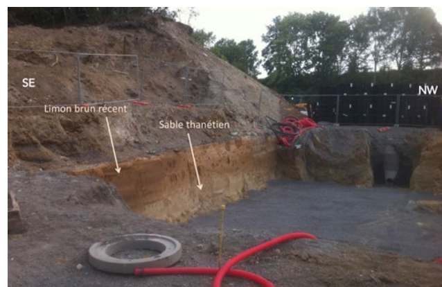
Fig. 4. – Prise de vue du point localisé sur la carte (Fig. 1) de fin 2011. Les talus terrassés (hauteur de 2 m environ) pour aménager l'accès au parking C1 destiné aux usagers du stade montrent un limon brun homogène et massif sur un ensemble vert brun qui devrait être un sable glauconieux et argileux. Le Tuffeau de Valenciennes semble absent.

Hors du chantier, face au Fort de Lezennes, un parking à étages (designé C1) a été construit en relation avec l'utilisation du Stade Pierre Mauroy. L'aménagement de son entrée avait demandé un léger décapage qui montrait, sous la terre arable, une couche d'ordre métrique de limon brun surmonté un sable roux, fin. Leur surface de contact n'était pas plane (Fig. 4, localisation sur Fig. 1). L'important est de constater que le tuffeau y est absent, conformément à ce qu'indiquait la carte géologique.