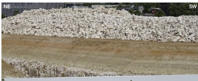
Fig. 3. – Prise de vue du 24 mai 2020 : depuis le point localisé sur la Fig. 1, vue du front de taille sud-est du plan incliné menant vers le stade. Au-dessus d'une craie en couches horizontales, mais très fissurée par des plans verticaux, la surface d'érosion, très nette et franche est couverte de la série dite landénienne sur la carte géologique (Feuille de Lille à 1 : 50 000). Sa composition est discutée dans le texte. Un remblai de craie couvre le tout. Fig. 3. – Photograph taken on May 24 th , 2020, from point located on Fig. 1: overview of the workfront (SE wall) of the climbing pathway going towards the stadium. Above horizontal chalk beds, with abundant vertical fractures, the erosion chalk erosion is a stiff surface; the Landenian series is clearly visible as described on 1/50 000 scale Lille geological map. Its composition is discussed within the text. A chalk ballast covers all.

Une seule photographie est présentée ici qui illustre bien la série couvrant la craie (Fig. 3). La prise de vue du 24 mai (localisation sur Fig. 1) montre un front incliné taillé dans une série finement et régulièrement litée, surmontant la partie verticale du front creusé dans la craie. Sur une épaisseur de l'ordre de 3 à 4 m (estimation par rapport aux personnes présentes sur le site) on peut distinguer, de haut en bas, sous le remblai composé de blocs crayeux en vrac :