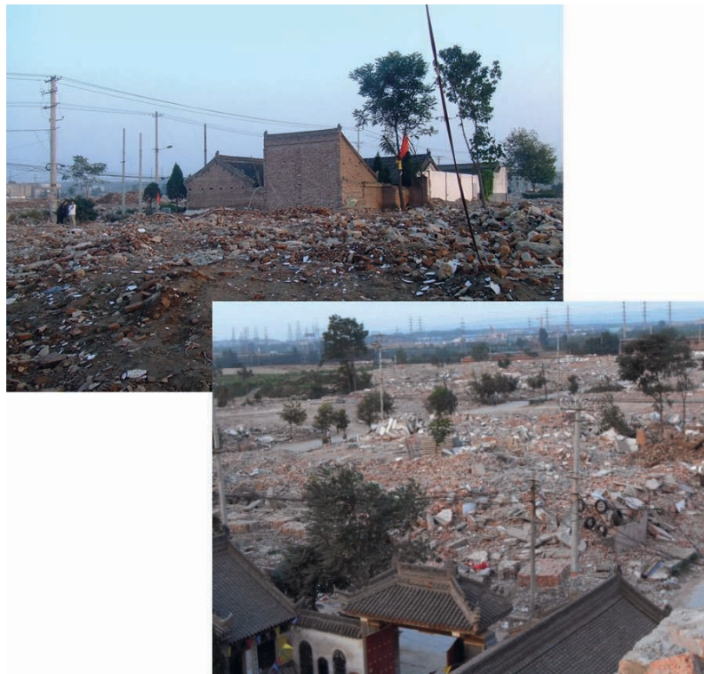
ILL. 1 – Le village de Qujiang rasé pour devenir un nouveau quartier de la grande ville de Xi'an

Seul le temple demeure dans un champ de ruines