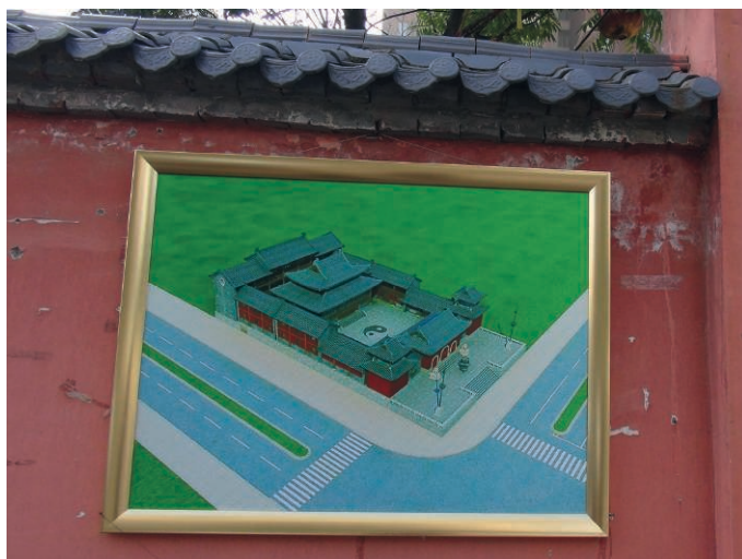
ILL. 9 – Le projet du futur temple Qinghua (rendu visuel)

une salle de méditation — ce dont avait toujours rêvé Huang — mais de surcroît un certain nombre de chambres pour recevoir des visiteurs, notamment à l'occasion des retraites individuelles ou collectives que Huang avait l'intention d'organiser. Un autre combat devait maintenant être mené : trouver les fonds pour financer un tel projet.