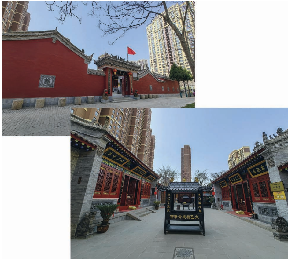
ILL. 10 – Le temple Qinghua en mars 2023

Rénové après que le village de Qujiang a été absorbé par la ville (cf. ill. 1 et 8)