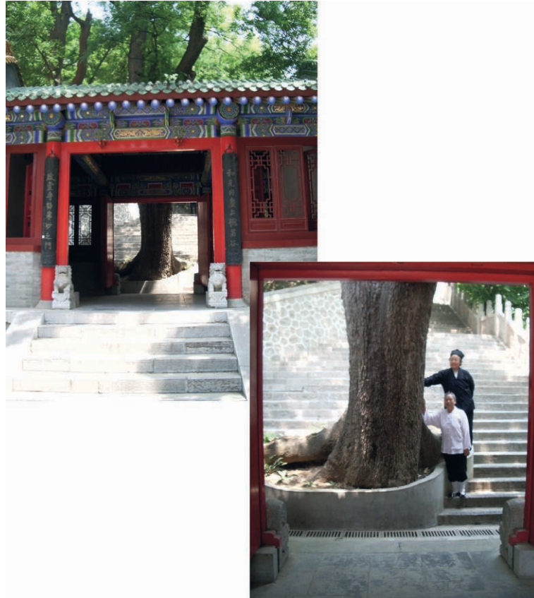
ILL. 11 – Un vieux arbre conservé au temple Louguantai, près de Zhouzhi (Shaanxi)