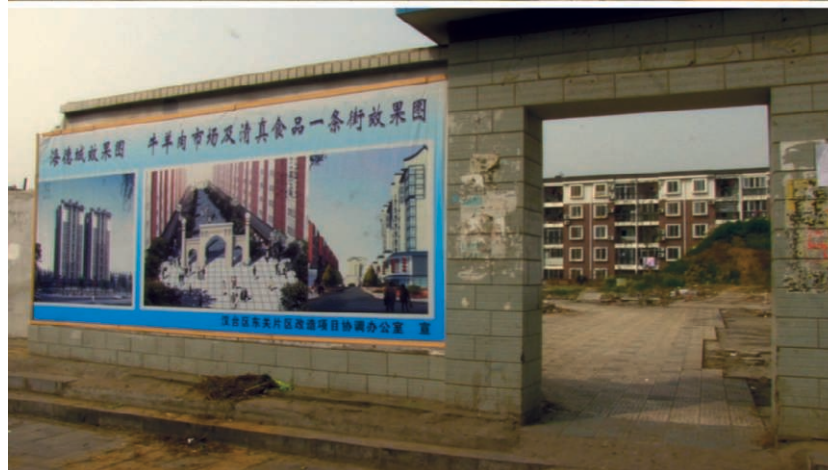
ILL. 5 – Le projet de réhabilitation du quartier de Dongguan : le recours aux rendus visuels ( xiaogoutu 效果图)