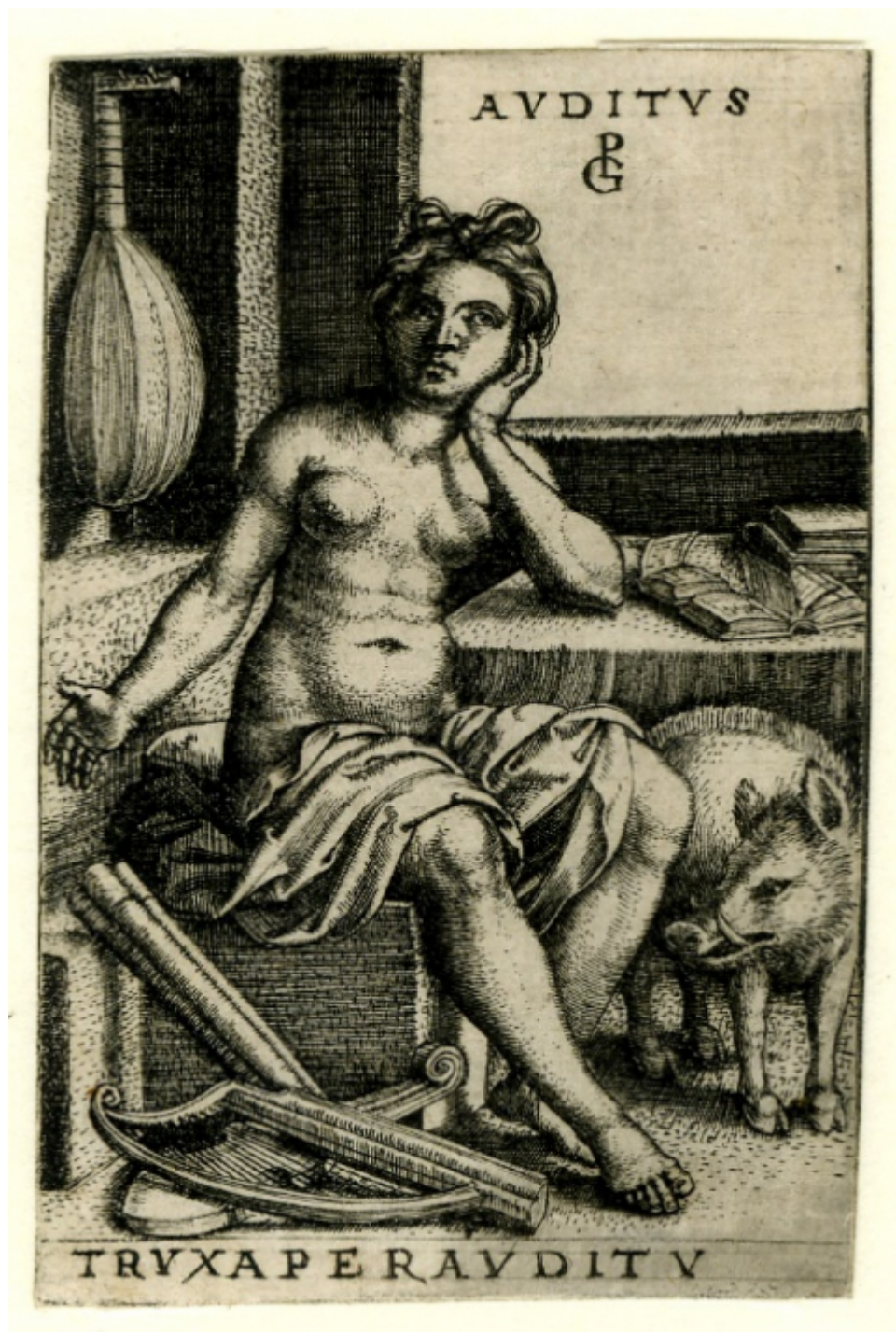
Georg Pencz, Auditus , c. 1544, gravure, 78 x 52 mm, Londres, The British Museum