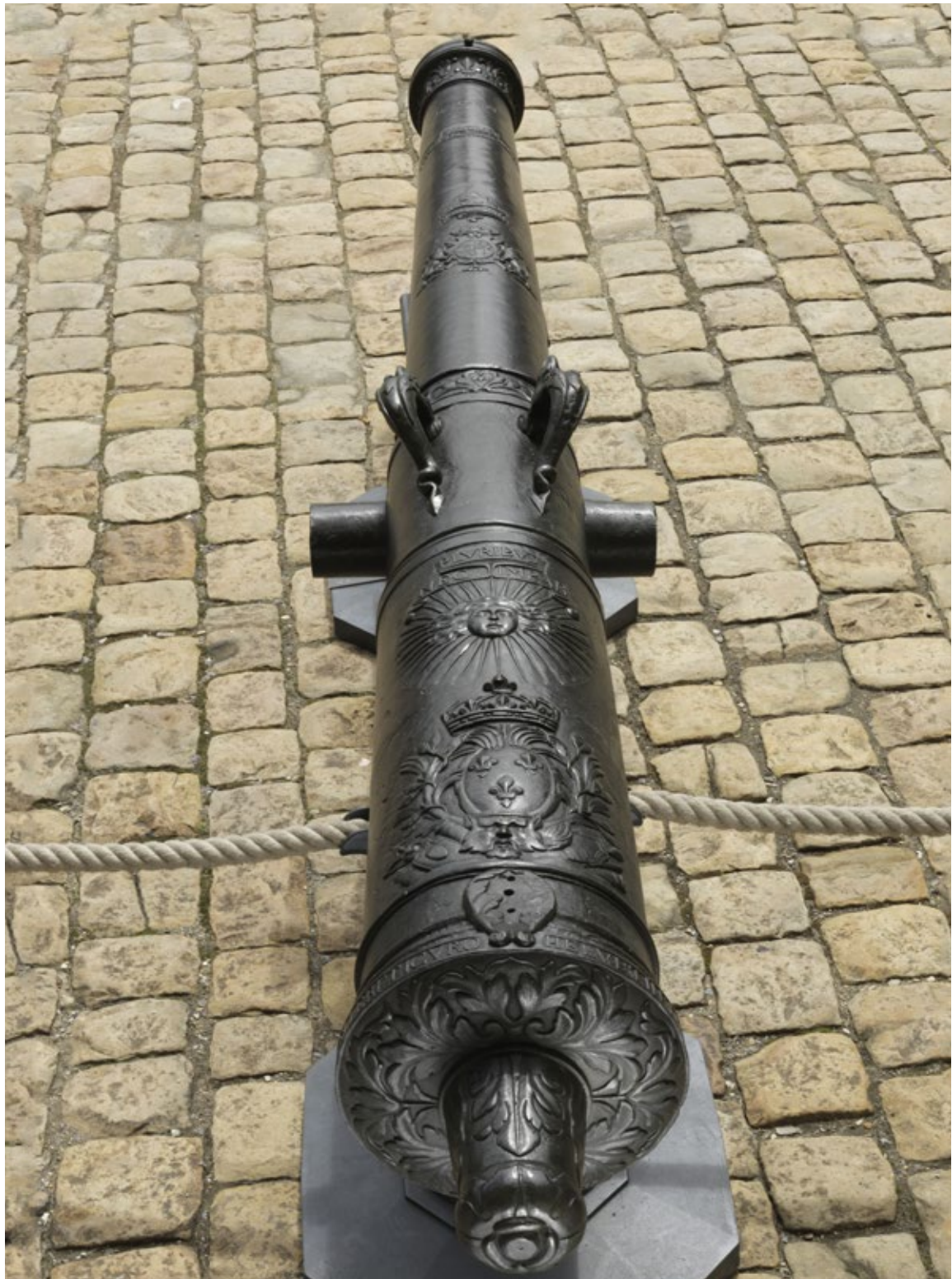
fig. 21 Canon Le Solide