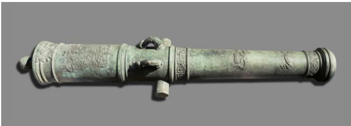
fig. 22 Canon El Tigre

C'est ainsi que quatre emblèmes rejoignent les trophées appendus dans la nef de l'église Saint-Louis des Invalides : un drapeau en soie capturé le 7 novembre lors d'une première attaque contre la forteresse 13 et trois drapeaux en étamine de très grand format pris – toujours dans la forteresse – le 7 décembre 1838, après la reddition finale de la ville 14 .