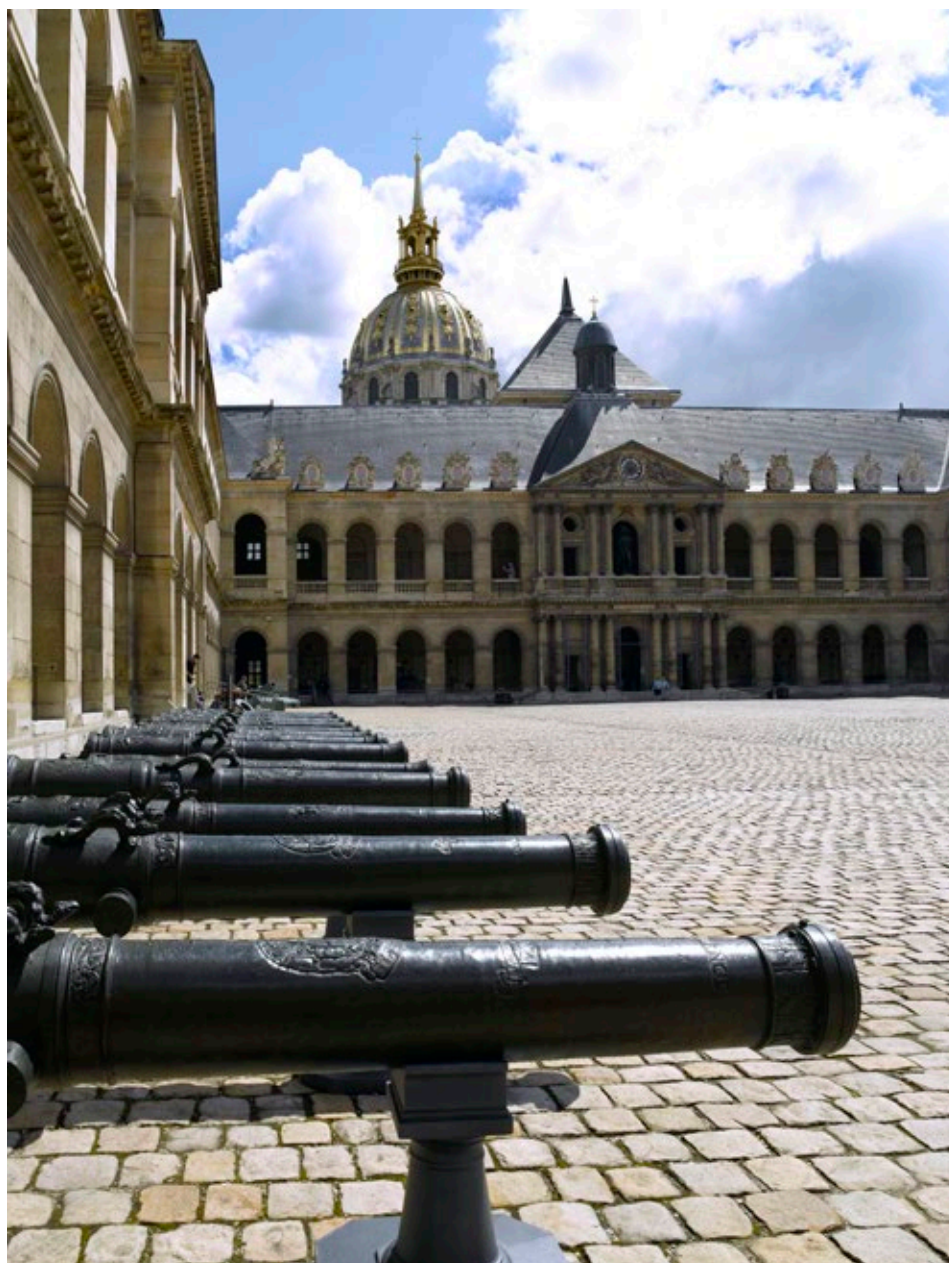
fig. 29 L'artillerie dans la cour d'honneur