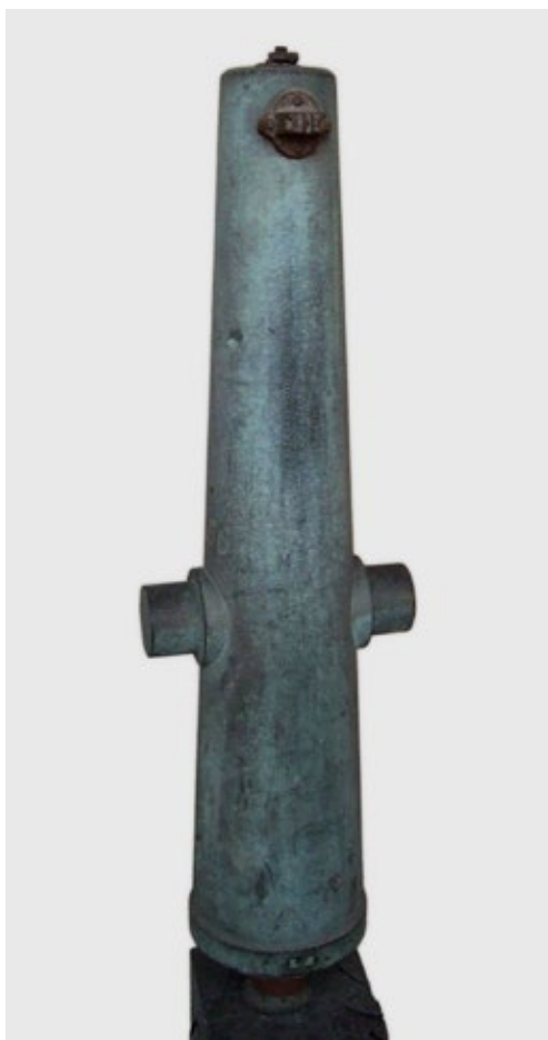
fig. 23 Canon Hotchkiss

Débarquée à Veracruz, l'armée française marche sur Mexico puis échoue le 5 mai 1862 dans une tentative d'assaut de Puebla. Des renforts supplémentaires sont envoyés 21 et l'année suivante, après deux mois de siège, les Français s'emparent de Puebla et s'ouvrent la route de Mexico. La capitale est prise le 7 juin 1863. Une régence se met en place avant que le Second empire mexicain soit proclamé le 10 avril 1864 22 .