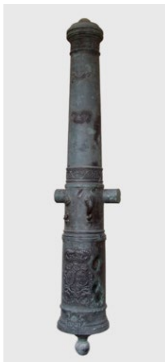
fig. 25 Canon espagnol