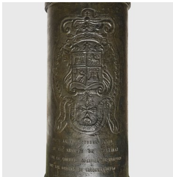
fig. 27 Elphevo, canon de 4 livres du règne de Charles III d'Espagne