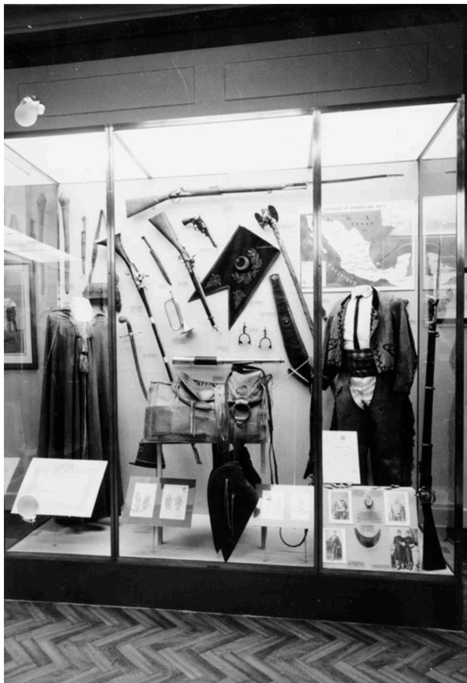
fig. 28 Vitrine de la salle Pélistier