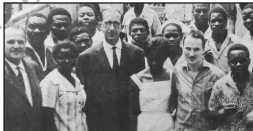
Fig. 3. – Lie Belin F100, Tchad, 1968

Ce travail d'élaboration s'est aussi appliqué à d'autres appareils, en particulier les magnétophones. Il semble que, dès 1958-1959, la firme Tolana, qui fournissait la RTF en magnétophones professionnels de studio 42 , se soit mise à produire des machines spécialisées pour la SORAFOM. C'est ce que montre un courrier de 1959 émanant du directeur de l'entreprise qui s'excuse du retard pris dans la livraison d'appareils « réalisés spécialement pour la SORAFOM 43 » et qui avait reçu un moteur spécial moins coûteux que ceux utilisés pour les magnétos de la RTF. La société avait mis au point les modèles 851, 1051 et 860 encore en service dans les radios durant la deuxième moitié des années 1960 44 . La société Lie Belin, branche de la société d'instrumentation Schlumberger 45 proposait aussi des magnétophones adaptés aux exigences de la SORAFOM/OCORA. Les modèles F.100 et F.101 étaient encore largement utilisés dans les studios dans la deuxième moitié des années 1960 46 , comme le montre cette photo (Fig. 3) prise au Tchad en 1968.