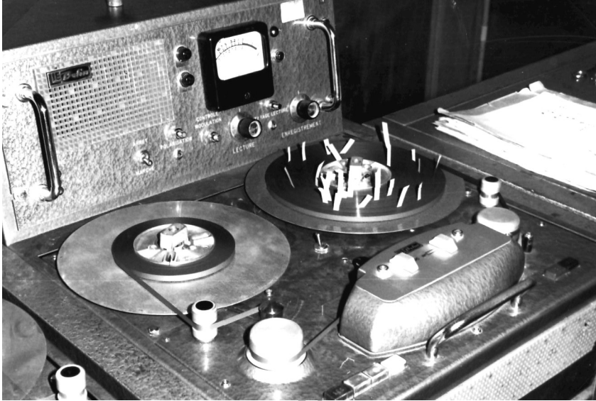
Fig. 4. – Jacques Lamarche, directeur technique de la SORAFOM, entouré de l'équipe de la radiodiffusion fédérale du Cameroun, 1962

tourné vers le nord du pays. Il se rend ensuite à Garoua pour étudier l'installation d'un futur émetteur de 30 kW et gagne le Tchad à Fort-Lamy. Là, il visite les futures installations d'un nouvel émetteur 97 .