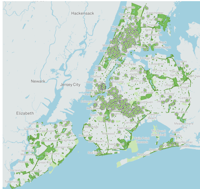
FIGURE 2 – implantation des jardins communautaire a New York

Importance du prototypage : La plantation de tournesols a servi de prototype, montrant les possibilités de revitalisation des zones négligées. Il a démontré l'impact des interventions à petite échelle et à faible coût sur le bien-être de la communauté.