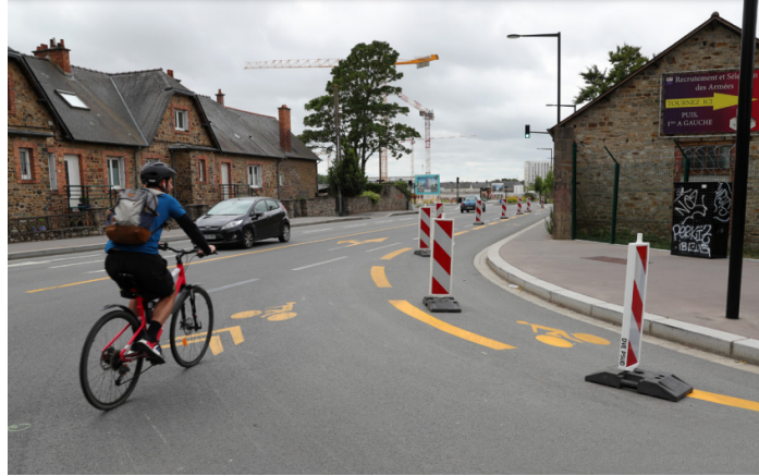
FIGURE 3 – Pistes cyclables provisoires déconfinement, St-Jacques-de-la-Lande - juin 2020

Importance du prototypage : Les pistes cyclables temporaires ont servi de prototypes pour évaluer leur impact sur la fluidité du trafic, la sécurité et l'acceptation par la communauté. Les données recueillies à partir de ces prototypes ont permis de décider de la mise en place d'une infrastructure cyclable permanente.