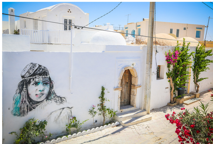
FIGURE 5 – oeuvre de l'artiste DABRO

Cette forme d'urbanisme tactique repose sur l'idée que des interventions artistiques temporaires peuvent avoir un impact significatif sur la perception et l'utilisation des espaces urbains. Les murs, les rues et les façades deviennent des toiles pour l'expression artistique, transformant ainsi l'île en une galerie d'art à ciel ouvert. (kilani, 2023b) L'aspect participatif de cette initiative réitéré en 2022 permet aux habitants de s'approprier l'espace public, renforçant ainsi le tissu social et la fierté communautaire. De plus, l'urbanisme tactique à Djerbahood offre une alternative à la planification urbaine traditionnelle en encourageant des transformations légères et flexibles qui évoluent avec les besoins changeants de la communauté.