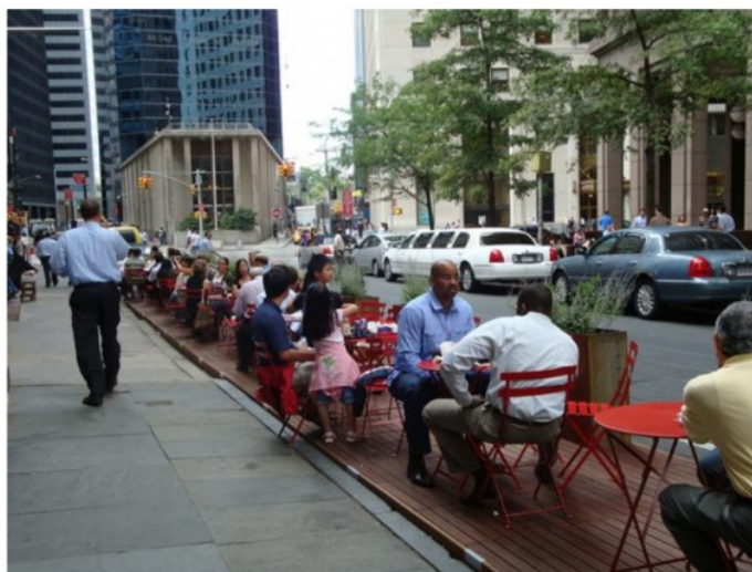
FIGURE 1 – Un « pop up café » à New York inspiré par le Park(ing) Day (Douay and Prevot, 2014)

Étude de cas : PARK(ing) Day offre la possibilité de créer des espaces publics temporaires, une place de parking à la fois. Cet événement mondial rassemble des citoyens, des artistes et des activistes qui convertissent des places de parking à horodateur en espaces publics temporaires. En 2005, Rebar, un studio d'art et de design de San Francisco, a transformé une place de parking à horodateur dans le centre de la ville en un parc public temporaire. À partir de cette initiative, le PARK(ing) Day est devenu un mouvement mondial. PARK(ing) Day est une initiative non commerciale qui stimule la créativité, l'engagement civique, la pensée critique, les interactions sociales, la générosité et le jeu.