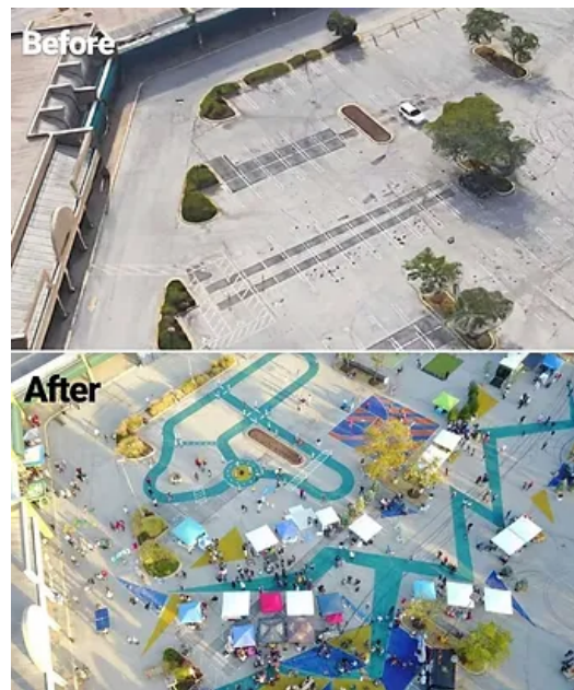
FIGURE 4 – le "Better Block Project" à Dallas (avant/après)