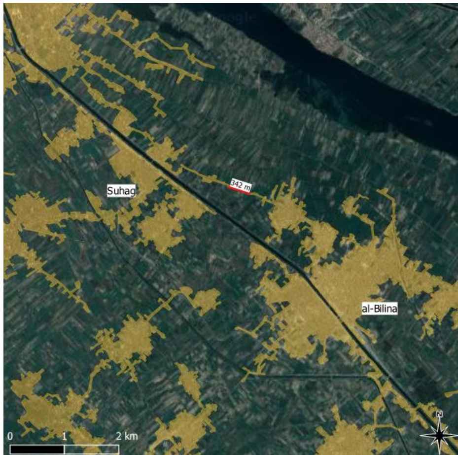
Figure 6. Combinaison de peuplement groupé et linéaire densifié dans le gouvernorat de Suhag (Egypte), à la limite des agglomérations de Suhag et Al Bilina (Al Balyana).

Les agglomérations de Suhag et Al Bilina (en orangé), dont les fronts ne sont distants que de 342 m (en rouge) et sont donc susceptibles de fusionner dans l'avenir, s'accroissent en combinant des formes groupées correspondant aux bourgs et des formes linéaires se déployant le long des canaux d'irrigation et des terre-pleins des routes, en évitant les parcelles cultivées (en sombre). En haut de l'image, en très sombre, on distingue le fleuve Nil.