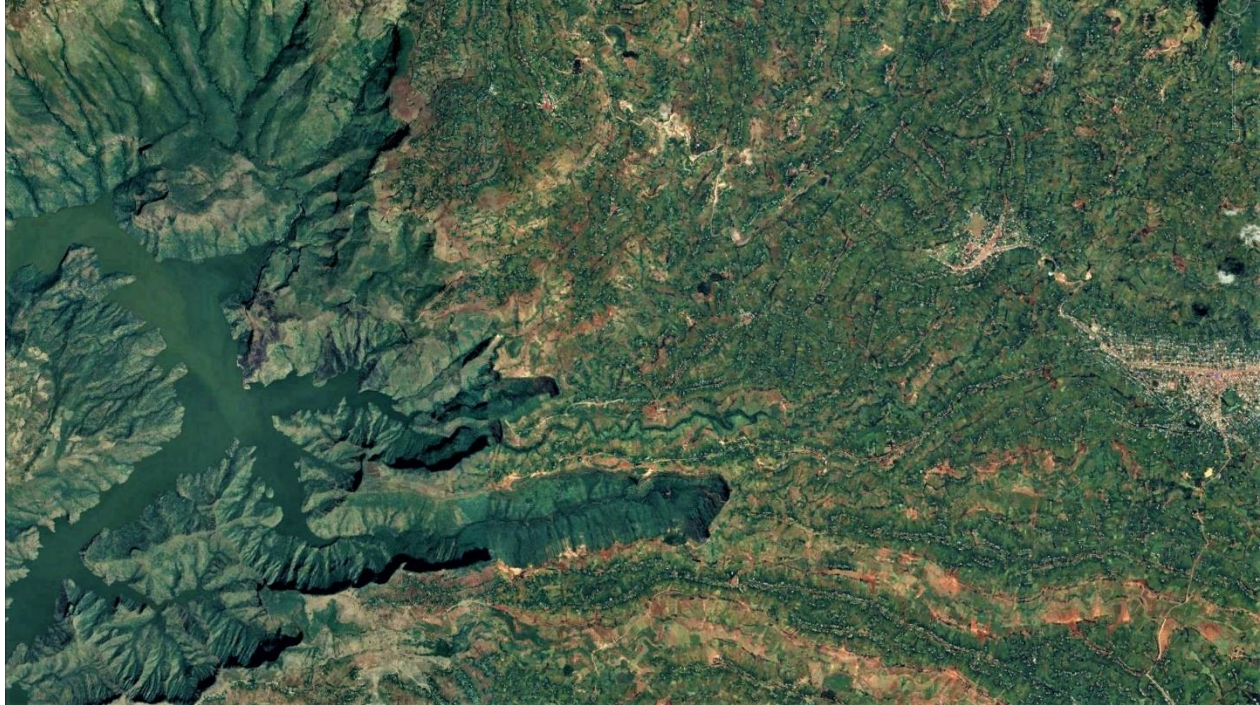
Figure 8. Un confinement naturel : la limite ouest de l'agglomération de Sodo (Ethiopie)

Dans ces trois exemples, le principe fondamental de la genèse des OGNIs est donc similaire. Le peuplement s'est d'abord disséminé, soit de manière éparse, soit dans de petits bourgs. Puis, une fois le territoire habitable et cultivable entièrement occupé, il s'est densifié sur place.