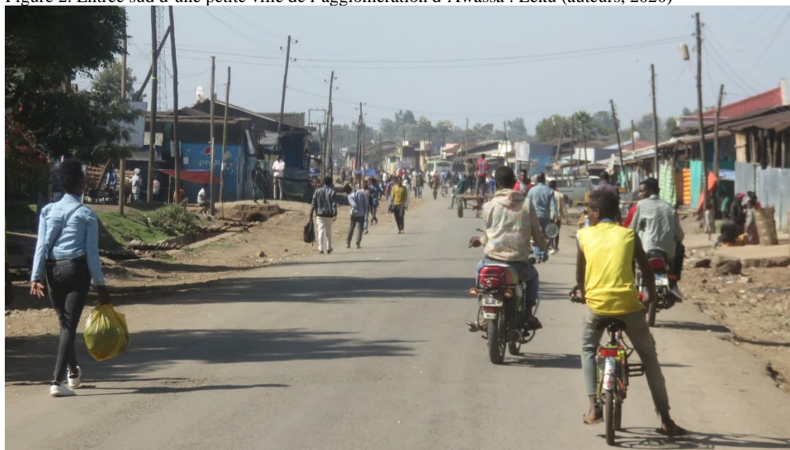
Figure 2. Entrée sud d'une petite ville de l'agglomération d'Awassa : Leku (auteurs, 2020)

Ainsi, Leku est une petite « ville » (selon les catégories éthiopiennes) de l'agglomération d'Awassa située à une vingtaine de km au sud de cette dernière. La photographie (fig.2) montre les nombreuses constructions bordant des routes, contribuant à la continuité du bâti, mais aussi accueillant toutes sortes de modalités de déplacement pour des activités diversifiées.