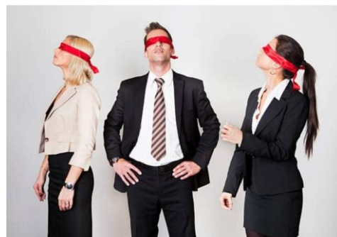
FAMILY DOCTORS, NEUROLOGISTS, RHEUMATOLOGISTS, AND INFECTIOUS DISEASE DOCTORS WHEN THEY LOOK FOR LYME DISEASE