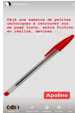
Figure 6 – Le post comme une lieu d'éducation à la pratique utilisateur

delà, un indexant programmatique. Le hashtag est aussi une alerte qui annonce une nouvelle chronique.