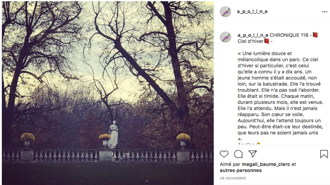
Figure 5 : Profil Instagram Apoline - Chronique 116 – Ciel d'hiver

en prenant par exemple des photos d'albums de famille en intégrant des éléments de fiction dans le récit accompagnant l'image. Le terme de diégèse m'a paru opérationnel pour désigner le récit dans ce projet car Gérard Genette l'emprunte pour désigner, en littérature, « l'ensemble des événements relatés par le discours narratif en tant que récit et comme histoire » (Genette, 1982). Le terme de « construction narrative » alimente donc l'idée de fiction.