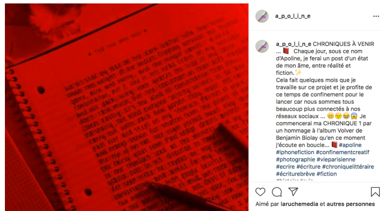
Figure 3 : le mur Instagram – première publication Apoline- annonce du projet