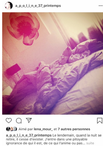
Figure 7 – Photo prise dans ma chambre lors d'un voyage