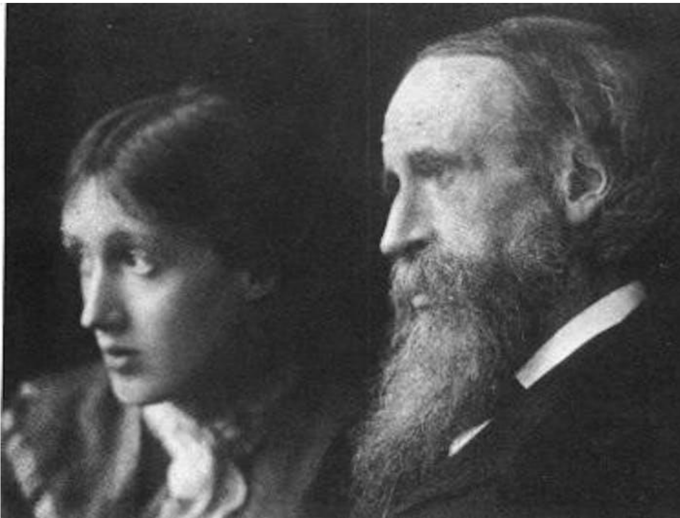
Virginia Woolf et son père Leslie Stephen, en 1902.

« Anniversaire de père. Il aurait eu 96 ans, oui 96 ans aujourd'hui, 96 ans comme d'autres personnes que l'on a connues. Mais Dieu merci, il ne les a pas eus. Sa vie aurait absorbé toute la mienne. Que serait-il arrivé ? Je n'aurais rien écrit, pas un seul livre. Inconcevable. »