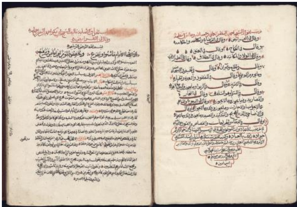
Première double-page : table des matières à droite, incipit à gauche

Commentaire rédigé en 1855, par un auteur inconnu, de l'ouvrage de droit musulman du 15 e siècle Al-ḥill wa-al-iṣāba (MS.4.188).