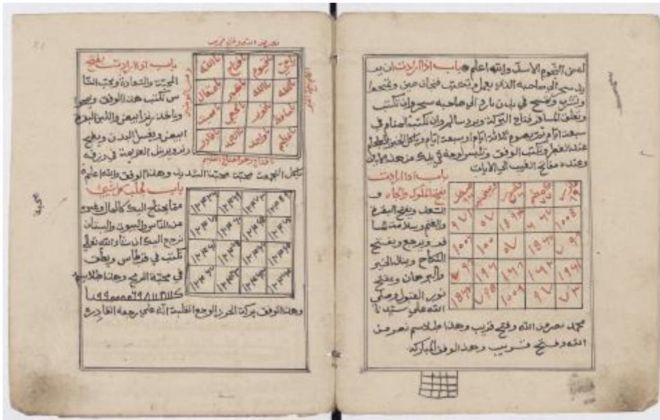
Cliché JPR-Bnu, CC BY-NC-SA