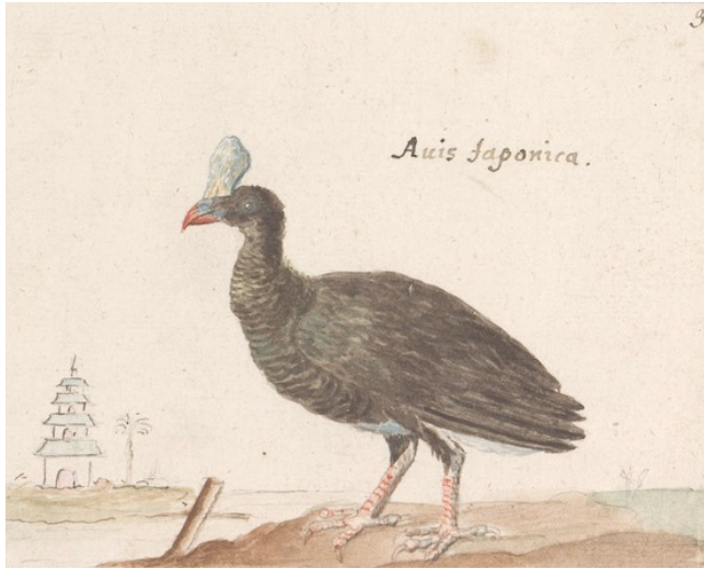
Fig. 6. “ Crax Pauxi/Pauxi pauxi/Avis Japonica ”

Fonte: Anselmus Boëtius de Boodt, 1596-1610, Rijksmuseum di Amsterdam.