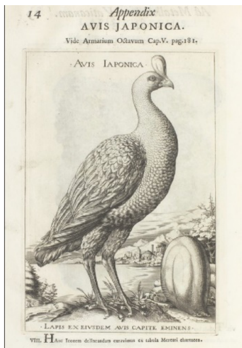
Fig. 1. “ Avis Japonica ”