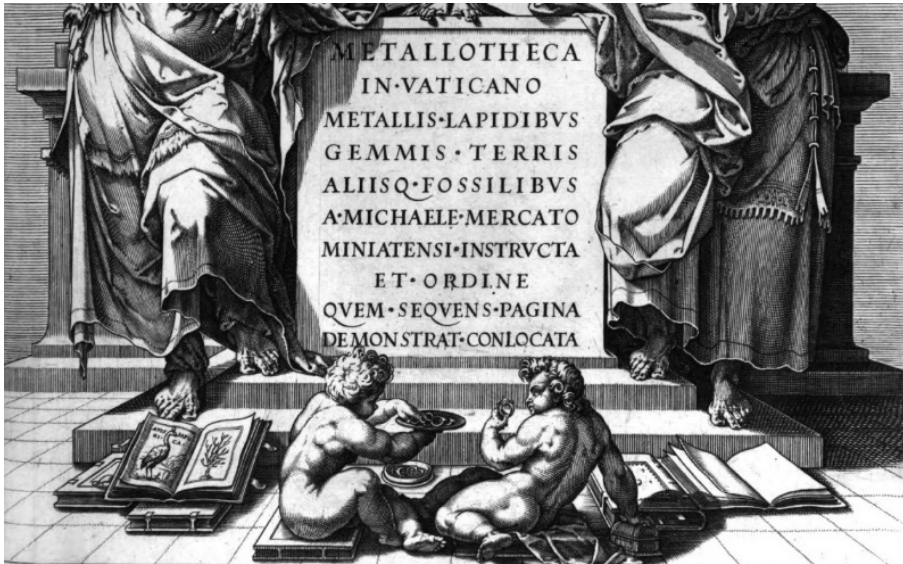
Fig. 4. “L’ Avis Japonica ”, frontespizio originale di Michele Mercati, dettaglio.

Fonte: Michele Mercati, Metallotheca. Opus Posthumum[...] cui accessit appendix cum XIX. Recensione inventis iconibus (Roma: G.M. Salvioni, 1719).