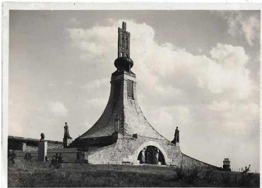
Le monument de Pratzen en 1933