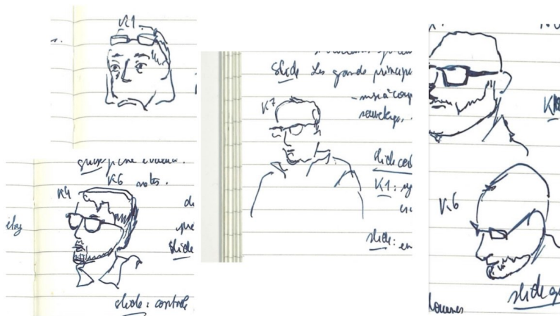
FIG. 1 : Cahier de terrain : croquis de C.Martel des stagiaires en formation

Les notes prises lors de la formation théorique, sur le contenu de formation et les réactions (verbales, comportementales) des formés, notamment lors des debriefings des mises en situation, ont été scrupuleuses lors des temps de formation. Afin d'identifier rapidement des stagiaires inconnus, ils étaient nommés et numérotés selon leur placement lors de la formation théorique (exemple pour la formation F2 : de J1 à J15), et des croquis (cf. Figure 3) permettaient d'associer ces numéros à leur personne. La chercheuse prenait également des notes concernant les mises en situation, a posteriori des journées de formation. Un long travail de retranscription des notes a été mené après les formations, dans les deux semaines qui suivaient.