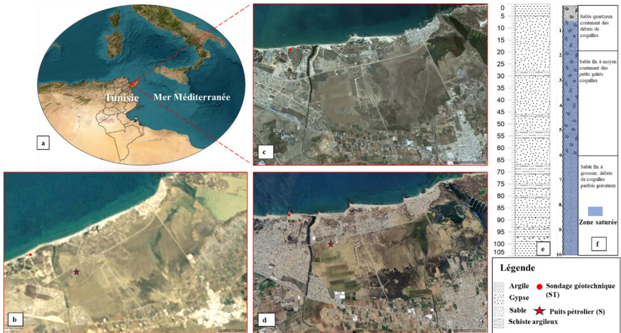
Fig. 1 – a) Localisation géographique de la zone d'étude b) Carte de la zone d'étude en 1986 c) carte de la zone d'étude en 2004 d) carte de la zone d'étude en 2023 e) log du forage profond S f) log du sondage géotechnique (ST)