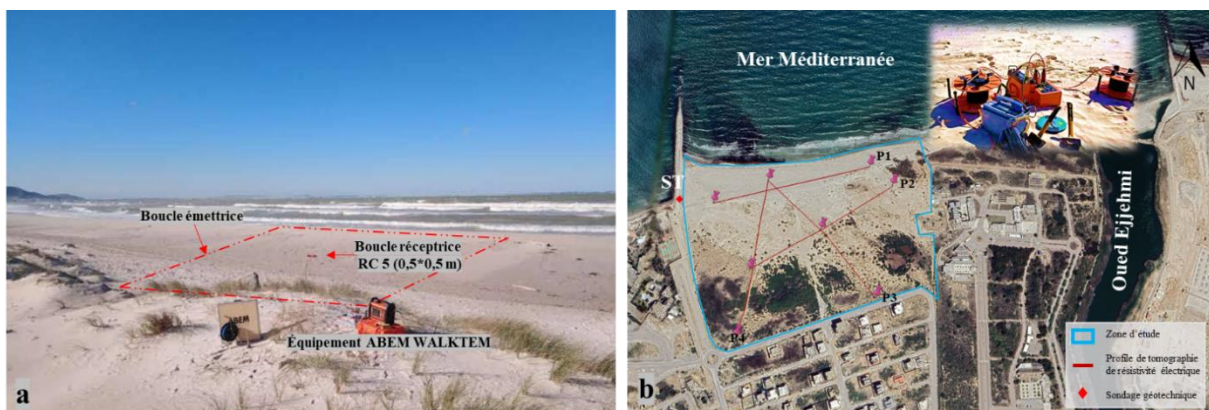
Fig. 2 – a) Photo d'acquisition TDEM avec équipements ABEM WALKTEM sur la côte de Soliman b) Carte de localisation de la zone d'étude et position des profils ERT et du sondage Géotechnique (ST)