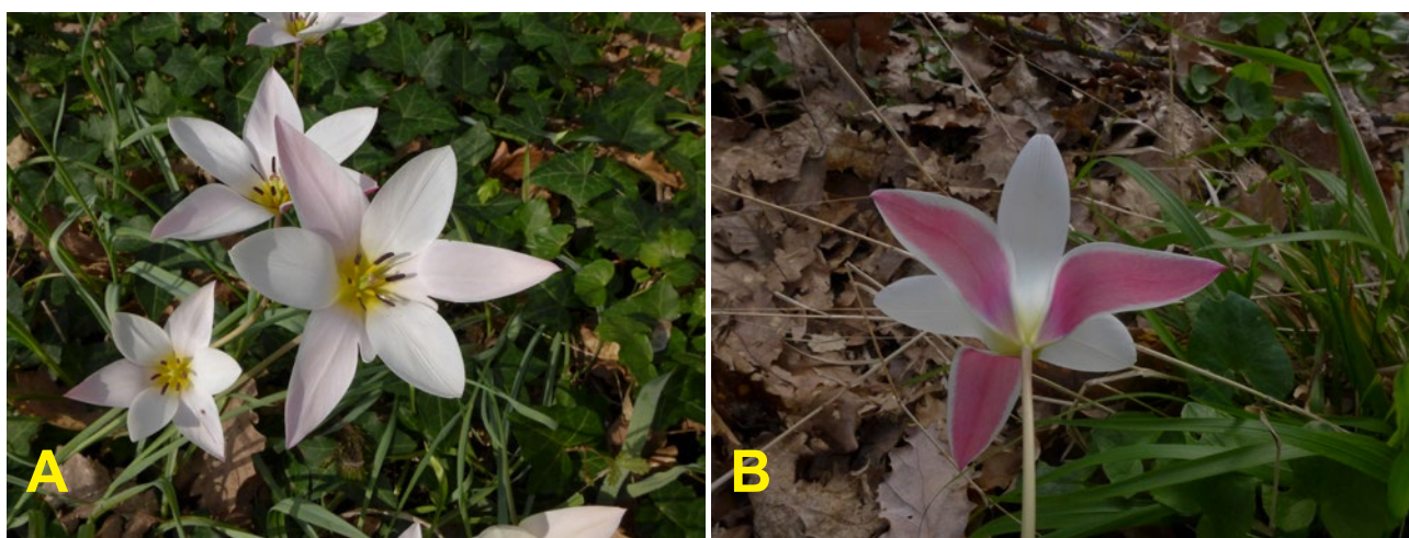
Fig. 8A et B. Tulipa clusiana.

subsp. Sylvestris (Lascurettes, 2004b). Ces tulipes, qui se comportent comme des adventices de la vigne, des vergers et autres cultures sarclées, y ont alors proliféré. Si la tulipe sylvestre n'est pas (encore) une plante extrêmement rare en France, elle pâtit des menaces irréversibles que sont l'urbanisation, l'utilisation des herbicides et, dans une moindre mesure, la cueillette sauvage. Elle mérite largement son statut d'espèce protégée en France. Toute nouvelle station tarnaise de tulipe sauvage est à signaler et à préserver.