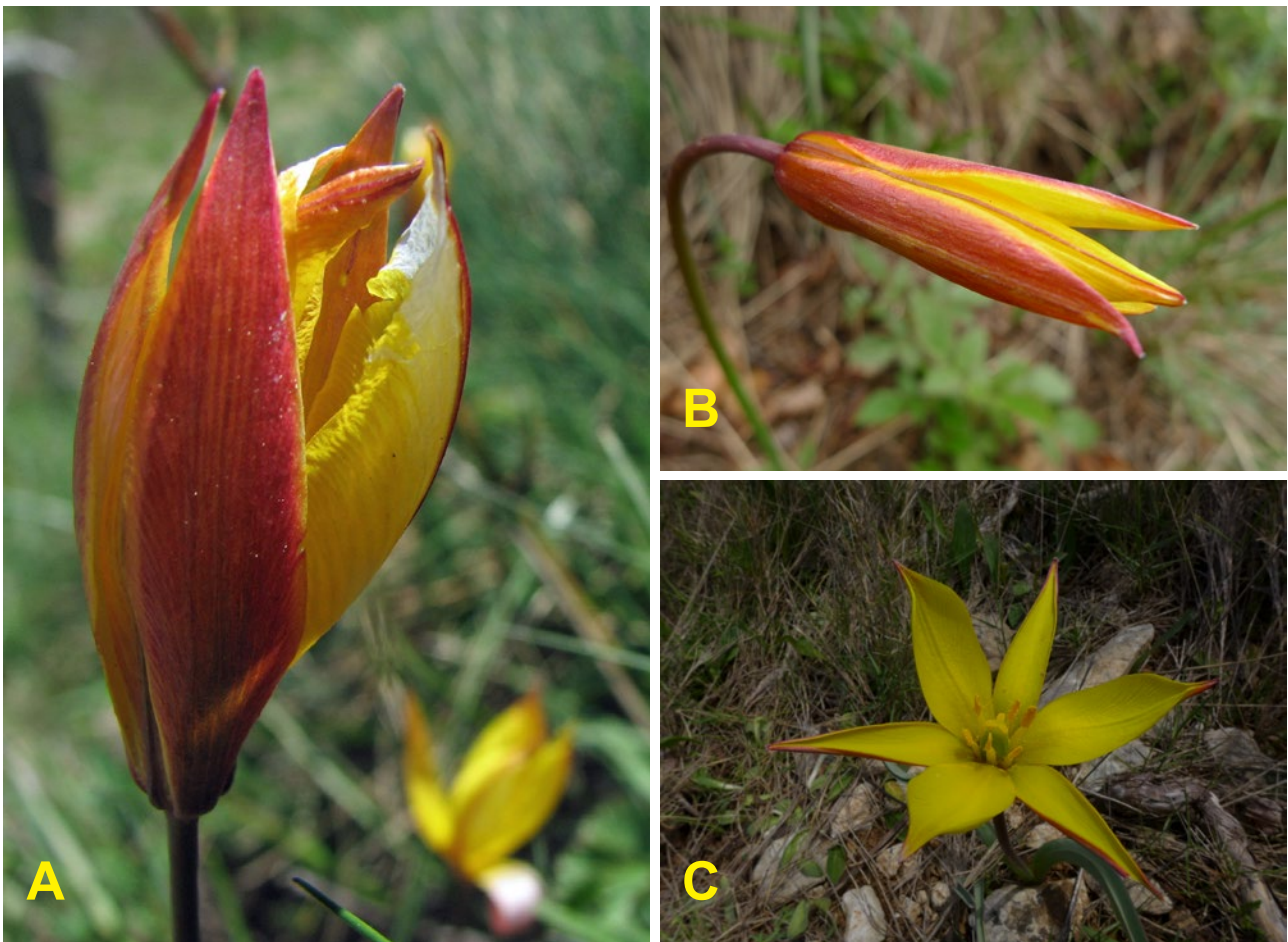
Fig. 5 - A. Tulipa sylvestris subsp australis (©MS) ; B. vue extérieure des tépales (©PhD) ; C. vue intérieure des tépales (©PhD).