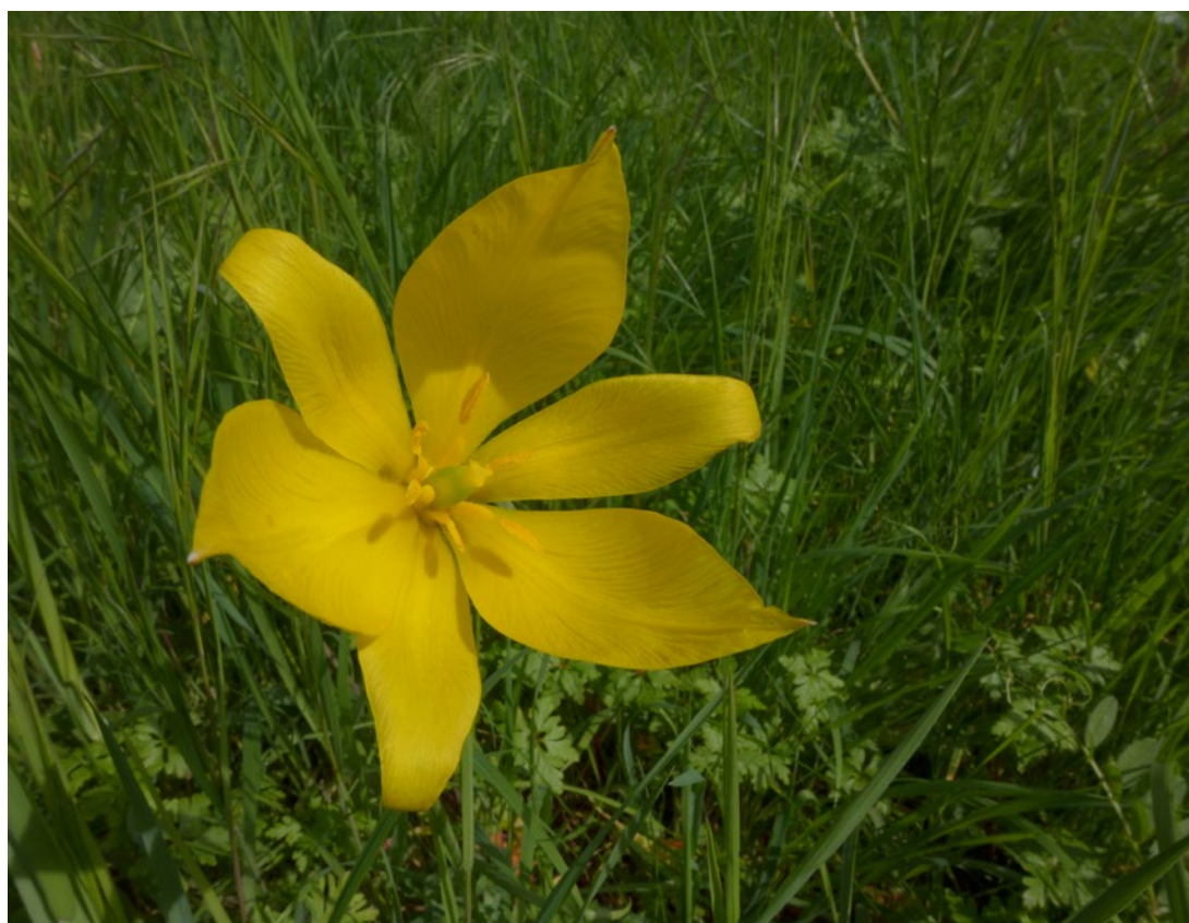
Fig. 1 - Tulipa sylvestris subsp sylvestris : vue intérieure des tépales.