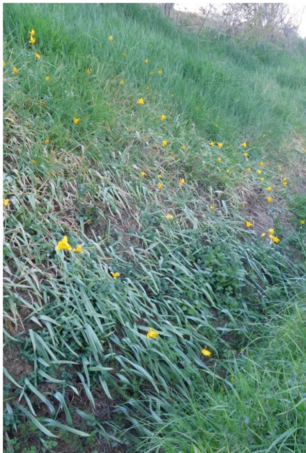
Fig. 4 - Exemple de talus non entretenu où se développe Tulipa sylvestris subsp. sylvestris.

Le sol correspond ici aux argiles du Bartonien moyen (source InfoTerre). Elle est victime partout en France de l'urbanisation, de l'intensification des pratiques agricoles, du recours quasi-systématique aux herbicides, ainsi que de la cueillette, malgré son statut réglementaire d'espèce protégée (Lombard et Bajon, 2000).