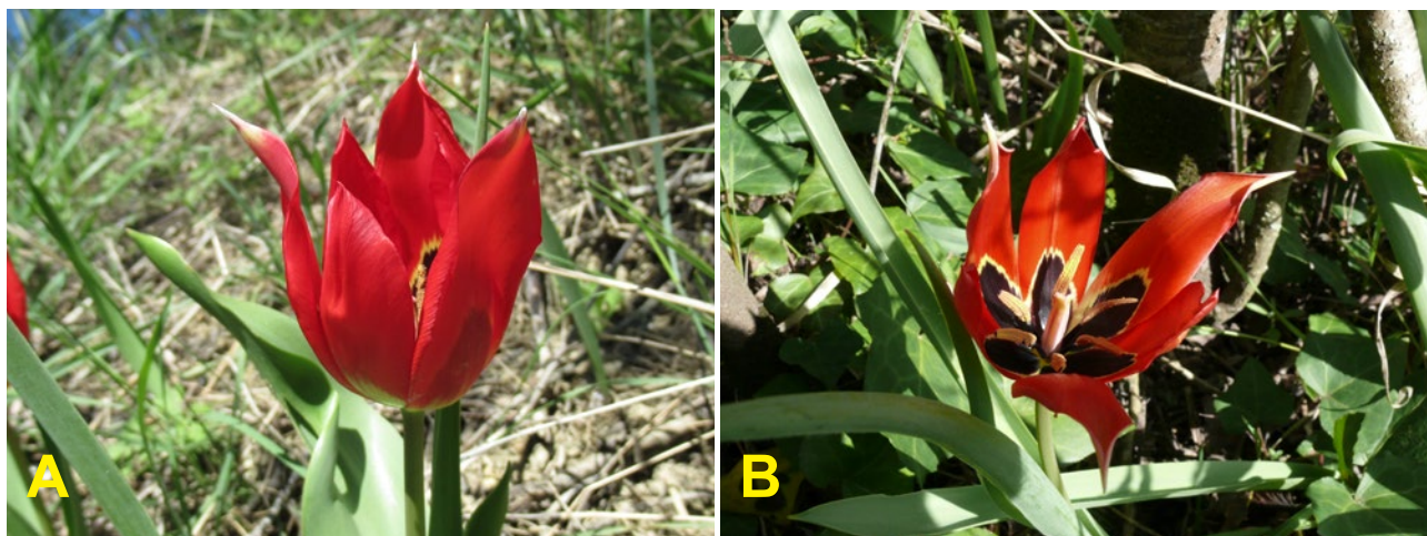
Fig. 7A et B. Tulipa agenensis . Tépales oblongs à lancéolés terminés en longue pointe (©PhD).