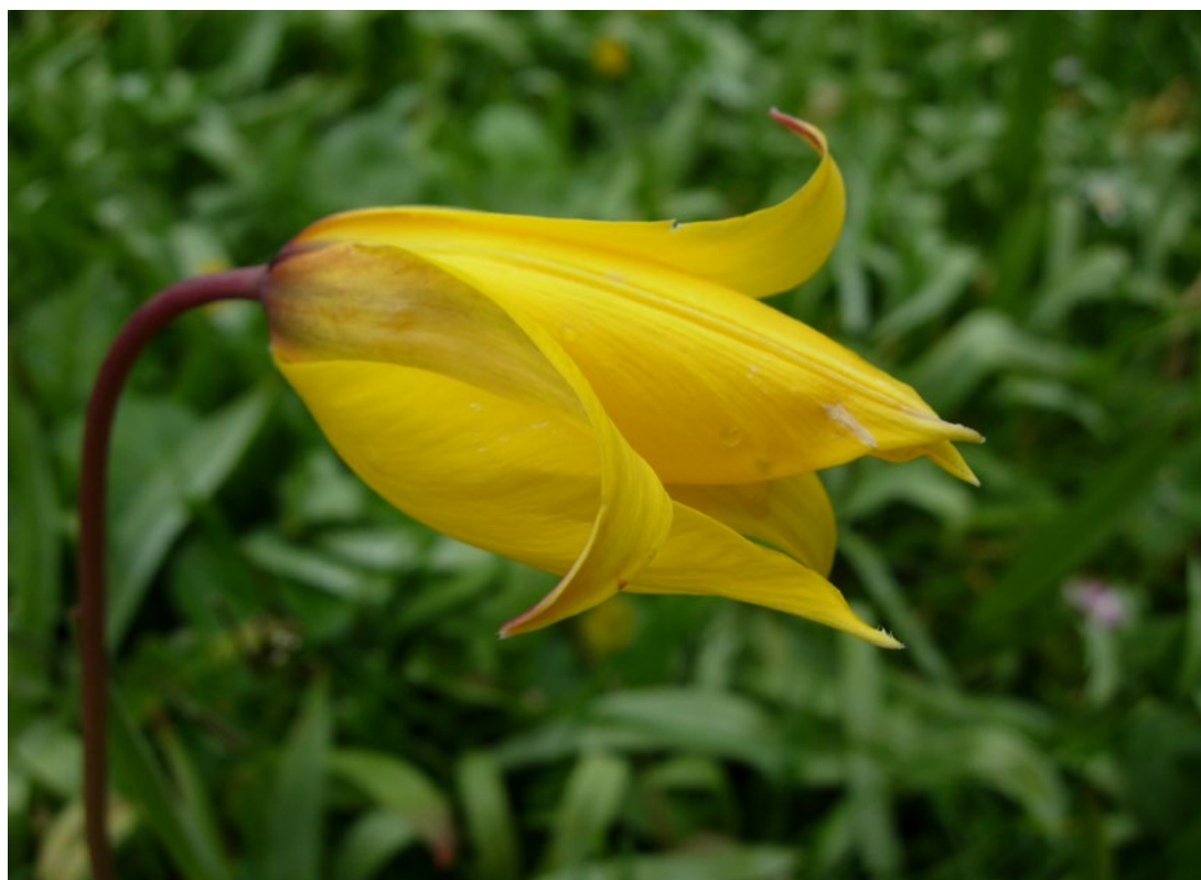
Fig. 2 - Tulipa sylvestris subsp sylvestris : vue extérieure des tépales.