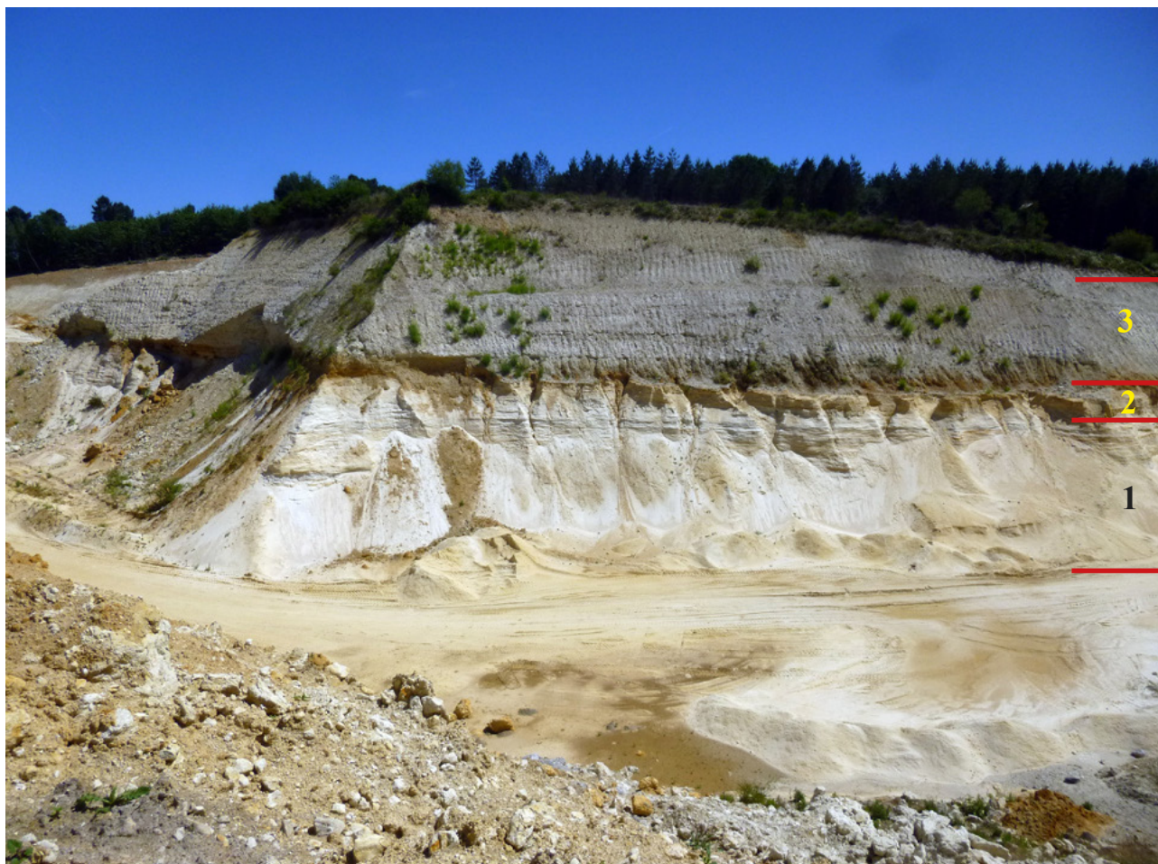
Fig. 1 - Carrière de Combiers. Aperçu du front de taille de la sablière (2018). De bas en haut : 1. Santonien : sables blancs santoniens exploités pour de l'optique ; 2. Cordon ferrugineux qui marque la limite entre le Santonien et le Campanien ; 3. Campanien : calcaire crayo-marneux, puis calcaire crayeux qui apparaît scrapé.

touché. Il renferme de nombreux agrégats de silice et livre des dents de squales, Cretolamna appendiculata (Agassiz, 1843) et Squalicorax pristodontus (Agassiz, 1843), ainsi que des dents du Mosasaure Mosasaurus hoffmanni Mantell, 1829. Cet horizon marque la limite entre le Santonien et le Campanien.