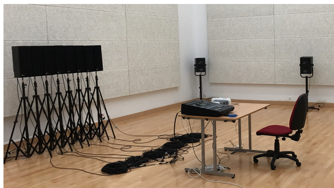
1. Maquette WFS installé à la Maison des Sciences Humaines, Laboratoire MUSIDANSE

L'entrée et sortie des signaux audio s'effectue par des entrées et sorties physiques ou virtuelles, et l'information sur la position spatiale de chaque source sonore, ainsi que le modèle physique de front d'onde à utiliser (source point, onde plane, source focalisée) se transmettent à travers le protocole OSC.