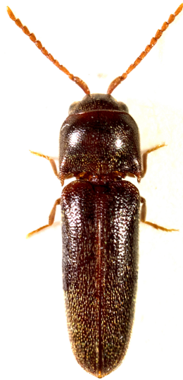
Figure 1. Microrhagus pyrenaeus (Coleoptera, Eucnemidae), ici nouvellement signalé dans les Bouches-du-Rhône, capturé à Fos – sur – Mer le 26 juin 2012.