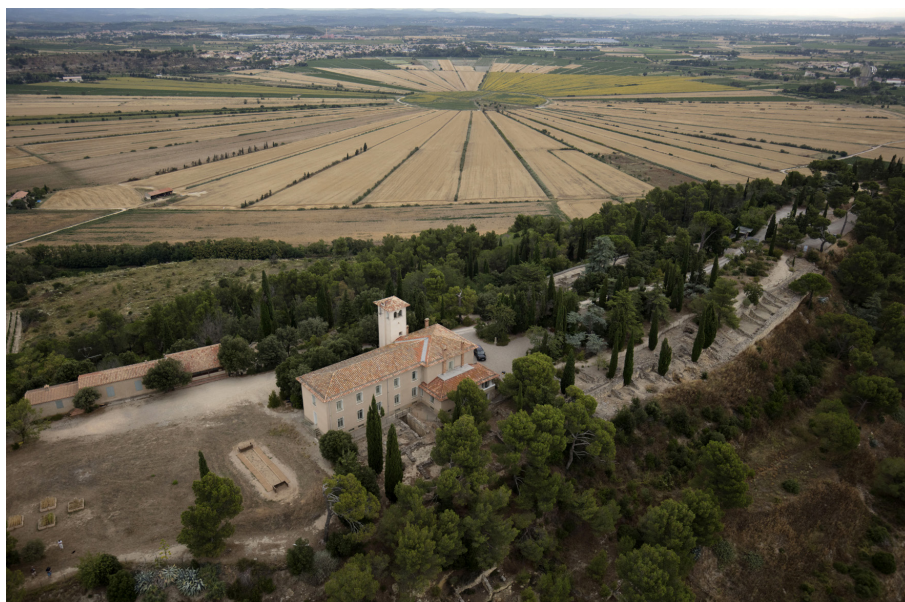
Fig. 3: Vue générale du site d'Enserune.