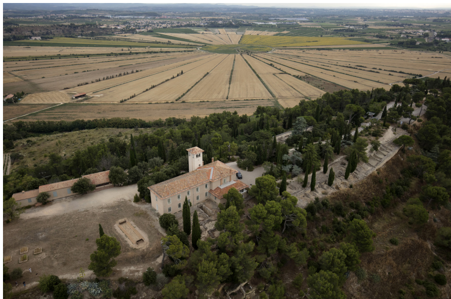
Fig. 3: Vue générale du site d'Ensérune.