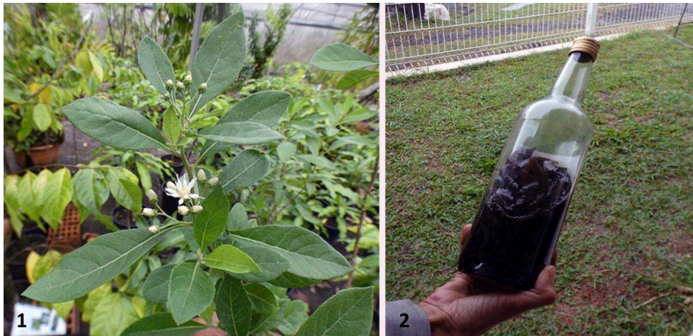
Figures 1 et 2 : G. amygdalinum en vente dans une pépinière. Feuilles de G. amygdalinum macérant dans une bouteille de rhum, chez un habitant de Sainte-Luce