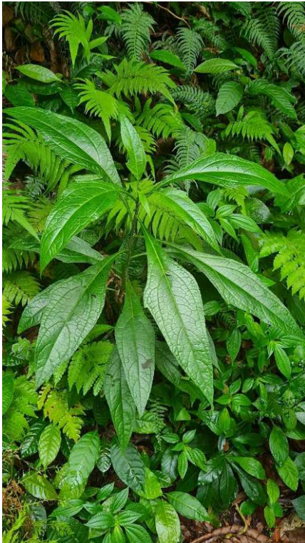
Photographie A Thésée