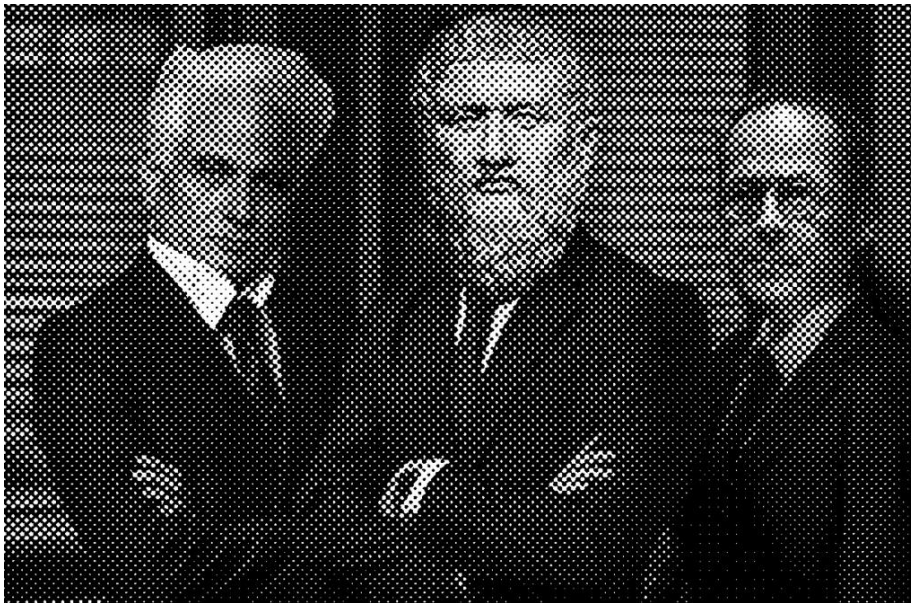
(fig.3) Derrida, Platon et Stiegler - montage photographique de l'auteur