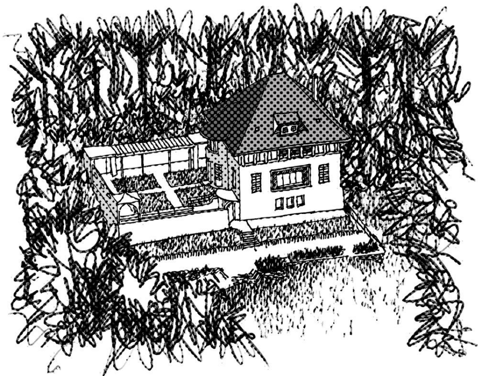
(fig.1) La Maison Blanche à La Chaux-de-Fonds - dessin de l'auteur