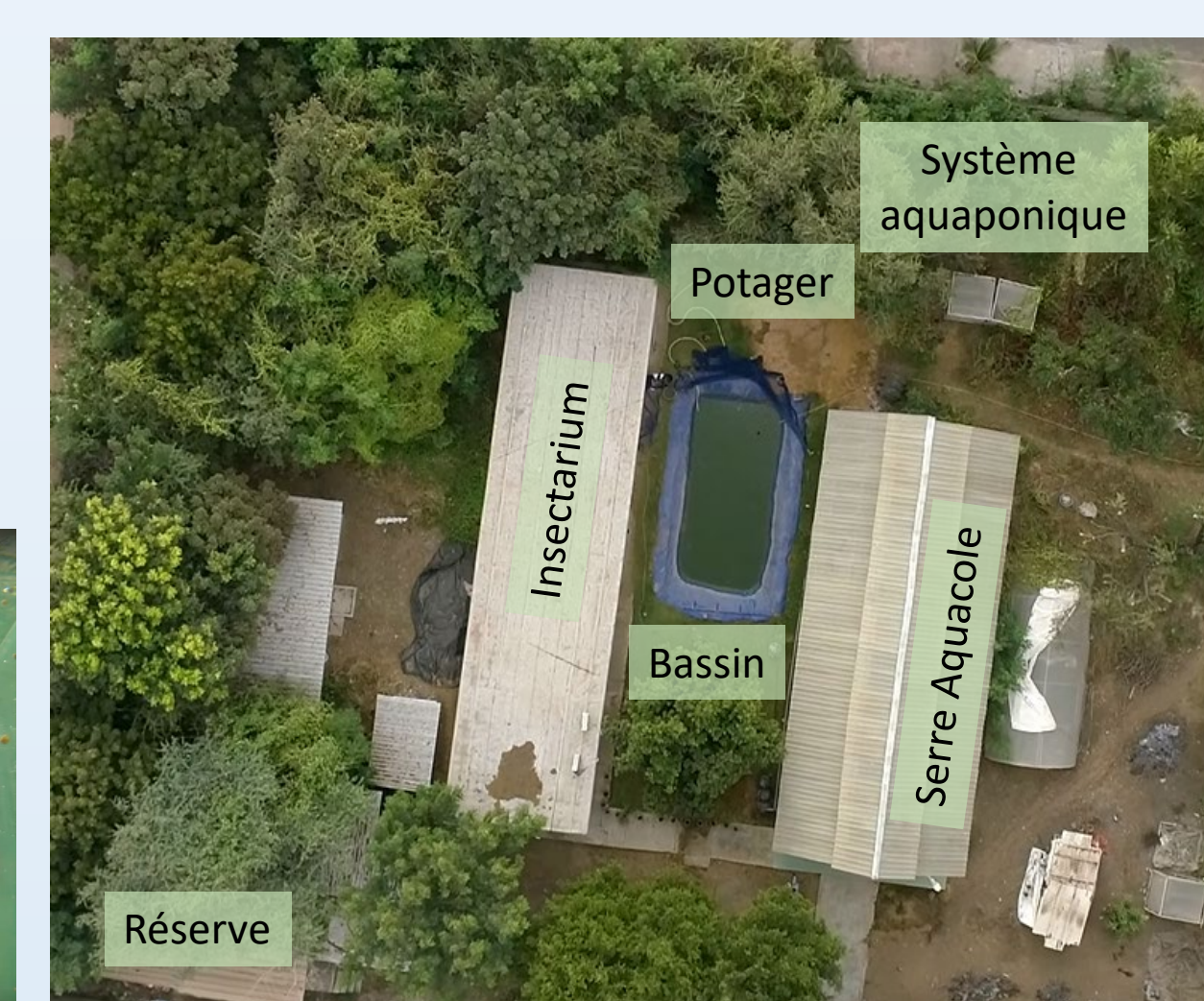
Art Sunu Gueej : une initiative pour soutenir le développement de l'économie bleue en Afrique