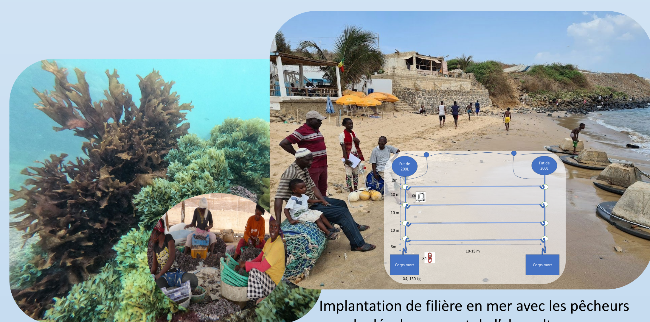
Implantation de filière en mer avec les pêcheurs pour le développement de l'algoculture.

Des progrès importants pour la valorisation des macro-algues. ont été réalisés, un inventaire par une approche taxonomique et génétique, des études sur la qualité nutritionnelle de plusieurs espèces ainsi qu'une étude socio-anthropologique. Enfin, des tests de culture sont en cours y compris de sporulation. L'algoculture apparaît comme une innovation majeure pour le Sénégal.