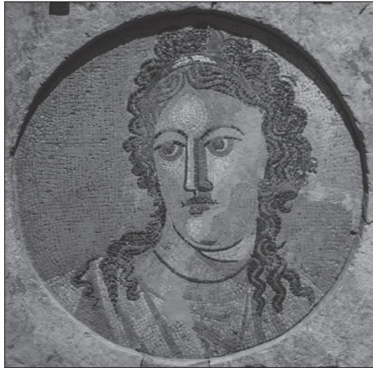
Figure 1. Mnémosyne : les mots fixent la mémoire des choses. Mnémosyne sur une mosaïque murale du II e siècle, musée national archéologique de Tarragone. Domaine public.

La question de la trace mnésique du mémoire est couplée à celle de l'évaluation, vue dans la perspective du laboratoire ADEF (Apprentissage, didactique, évaluation, formation) de l'université d'Aix-Marseille et en particulier à la question des valeurs et du sens donné à son travail d'évaluateur (l'intelligibilité de la situation d'évaluation) – ce sont les fondements et les voies de recherches ouvertes par Jean-Jacques Bonniol et Michel Vial (1997) sur lesquelles nous travaillons et reviendrons dans notre revue de littérature.