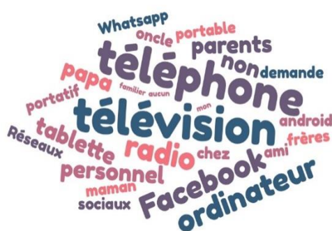
Figure n° 2 : Nuage de mots-clés sur l'accès aux TIC à domicile

L'implication des parents dans l'accès aux TIC par leur enfant consiste aussi en ce que les parents représentent les personnes qui initient leurs enfants. Ils sont présents au moment des premières expériences de leur enfant et participent à leur faire découvrir ces « nouveaux » outils. Ce qui se manifeste, entre autres récits, au travers de ces mots lorsqu'il a été demandé à une adolescente de 17 ans en classe de Tle comment elle en est arrivée à utiliser les appareils de communication : « J'ai des exercices et pas de téléphone. C'était compliqué. J'ai demandé à papa de me trouver les réponses. Il est allé les chercher sur son téléphone. Lui-même a vu que c'était important, donc il m'a acheté ça (un téléphone). C'est comme ça que j'ai commencé à utiliser mon téléphone portable pour les recherches de l'école et pour d'autres recherches qui sont en dehors de l'école » a-t-elle laissé entendre. L'image suivante montre, non seulement les outils les plus présents dans le quotidien des adolescents, mais aussi les mots-clés essentiels qui caractérisent et organisent par là même les principales logiques qui guident l'accès aux technologies.