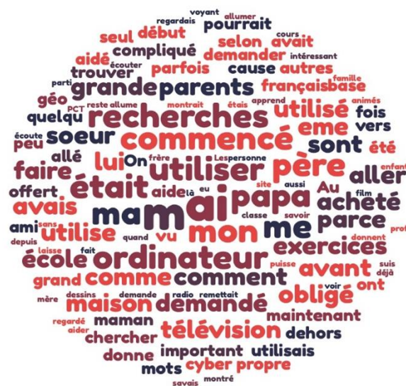
Figure n°3 : Nuage de mots-clés de la première expérience des usages chez les adolescents