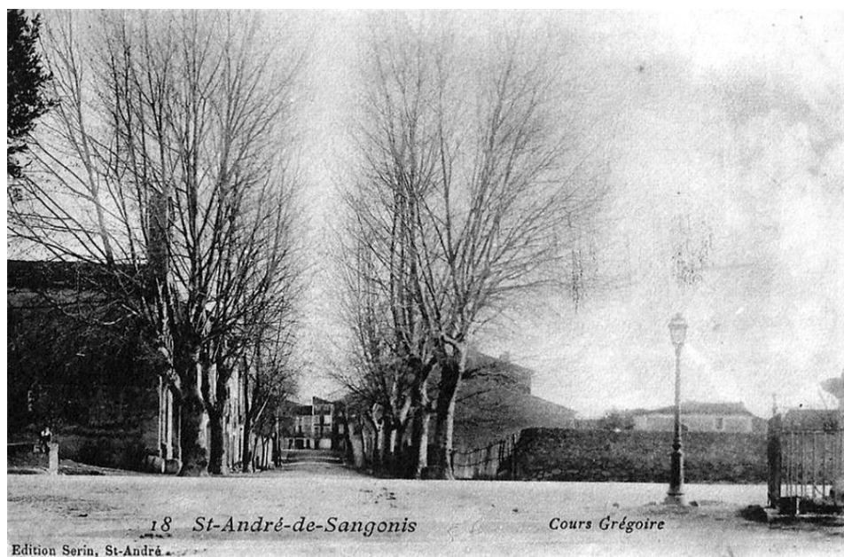
Figure 4 : Carte postale début XX e siècle. Le cours Grégoire à St-André-de-Sangonis.