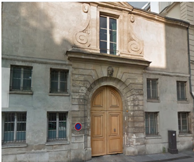
L'immeuble du 9 rue de la Perle dans le quartier du Marais : à l'entresol, l'enfilade de pièces où NABU était fabriqué, puis assemblé.

La fabrication se faisait – et se fait toujours – par photocopie. Au début, l'assemblage des fascicules et l'agrafage étaient effectués à la main : tous ceux qui travaillaient rue de la Perle étaient sollicités pour l'exercice. Ce n'est qu'au bout de plusieurs années que fut utilisé un photocopieur qui faisait ce travail automatiquement de façon fiable. Autre travail fastidieux : l'achat des timbres avec, à l'époque, 5 zones tarifaires différentes. Il fallait parfois coller jusqu'à 6 ou 7 timbres sur chaque enveloppe pour arriver à la somme due selon la destination... Cela a pu ravir les lecteurs de NABU philatélistes : mais le passage (récent) à l'affranchissement en ligne a été une libération !