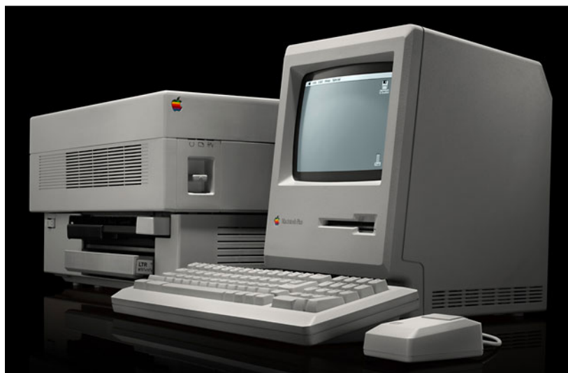
Publicité d'Apple en 1986 : Macintosh Plus et LaserWriter.