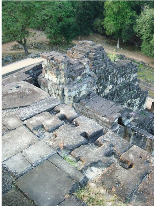
Fig 1. Exemples de crampons et logements repérés dans la pierre. Preah Khan d'Angkor: crampon retrouvé par le WMF dans la « salle aux danseuses ». Palais royal : crampons retrouvés par ITASA dans les gopuras. Baphuon : logements identifiés dans l'arase d'une assise.

L'étude de cet objet se révèle intéressant car, fabriqué en fer à partir du X e siècle, il présente la particularité d'avoir été mis en œuvre, au moins jusqu'au XIV e siècle, pour un usage fonctionnel au gré des campagnes de construction des édifices angkoriens. Des crampons ont ainsi été retrouvés au palais royal (X e -XI e s.), au Baphuon (XI e s.), à Angkor Vat (XII e s.), au Preah Khan d'Angkor (fin XII e s.), à Banteay Chhmar (fin XII e s.), à Ta Som (fin XII e s.) et au Bayon (XII e -XIII e s.). Une terminologie variée a souvent été employée pour décrire leurs formes, mais ils n'ont jamais fait l'objet d'une étude typomorphologique poussée. Aucune recherche ne s'était également employée à étudier le fer qui les compose. Pourtant, à ces périodes et dans ce contexte, le produit « métal » piège dans sa matière les traces des matières premières utilisées et des techniques mises en œuvre de la réduction à la post-réduction pour le cas des objets finis. L'étude matérielle et multi-échelle de l'objet est donc centrale puisque ce dernier enregistre, en quelque sorte, les informations de la chaîne opératoire complète. L'analyse de ces crampons se révèle donc un moyen d'éclairer le travail des artisans du fer à l'époque angkoriennne, l'organisation des productions, et la circulation des produits.