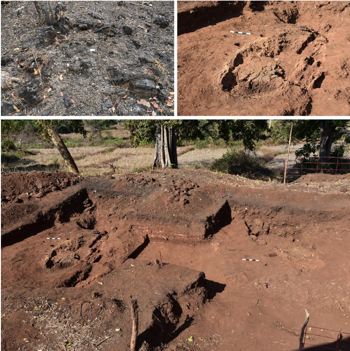
Fig 3. Fouille de l'atelier métallurgique de Tonle Bak (XII e -XIII e siècle) dans la région du Phnom Dek. (Haut) Amas de scories de fer et vestige d'un four de réduction de l'époque angkorienne.

révélant des épisodes de transition et d'évolution explicites dans la mise en place des procédés métallurgiques. Des phases successives d'occupation des territoires et de procédés techniques, en lien avec l'accès aux ressources et les moments stratégiques de l'expansion de l'Empire angkorien sont aujourd'hui précisées (Leroy et al., soumis). Les signatures des ateliers de cette vaste région métallurgique ont été caractérisées à partir de l'étude chimique in situ et de laboratoire des déchets de production, scories de fer essentiellement. Le croisement des données selon une méthodologie ajustée aux contextes a abouti à la proposition d'une classification des ateliers ou ensembles d'ateliers définissant ainsi nos référentiels d'étude.