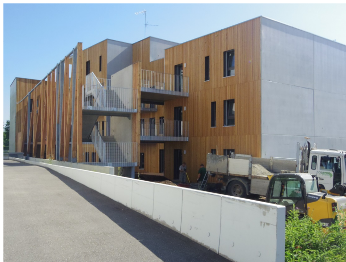
Illustration 4 : Écoquartier Danube, Strasbourg : L'opération d'habitat participatif « Ecoterra », société coopérative d'HLM Habitat de l'Ile, DWPA architectes

Les associations jouent un rôle central dans la réalisation du projet. L'une d'entre elles, l'association Eco-Quartier Strasbourg, soumet à la Ville une proposition contenant des méthodes et outils de conduite de la démarche participative pour le projet Danube. La ville s'en inspire. Elle se laisse également convaincre de réserver des terrains de la ZAC pour la construction de logements en autopromotion. L'association accompagne alors plusieurs initiatives citoyennes qui débouchent sur la réalisation de deux projets. L'opération Ecoterra, encadrée et portée par Habitat de l'III (société coopérative d'HLM), comprend 13 logements en accession sécurisée. Les habitants sont surtout associés dans les phases de conception. Le collectif E-Zero, constitué en association de droit local, réalise 4 logements. En qualité de maître d'ouvrage, il prend en charge le montage et la programmation, ainsi que le choix de la maîtrise d'œuvre.