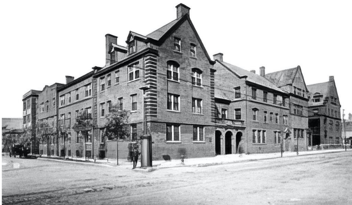
Figure 3. La résidence sociale de Hull House