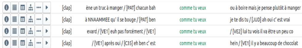
Fig. 1: Extrait de la concordance KWIC de comme tu veux dans le CEFC-ORFEO

Une fois la requête lancée, l'utilisateur peut afficher les concordances, sous format KWIC ou obtenir un contexte plus large (cf. figure 1). Il peut aussi écouter les segments où apparaît la requête (grâce à l'alignement texte-son effectué dans le corpus) ou visualiser les arbres syntaxiques associés.