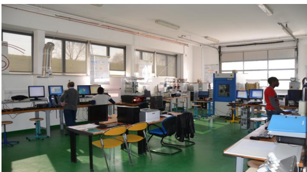
Figure 2. Salle principale de supervision

La salle de supervision et connectée est illustrée sur la figure 2, où chaque ordinateur ( 20 ordinateurs) est équipé d'un logiciel spécifique suivant le souhait de l'entreprise partenaire de la plateforme.