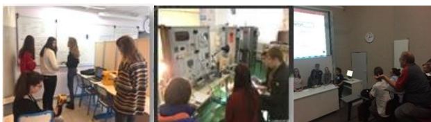
Figure 3. Les phases de réflexion, expérimentation, résultats

Le stage proposé par Tous Chercheurs de Metz [9] avait pour objectif de réfléchir à la conception d'un éco-paquebot utilisant les technologies énergies gratuites naturelles ou énergies propres tout en étant respectueux de l'environnement. Les thèmes proposés sont: photovoltaïque pour un site isolé, photovoltaïque en conditions réelles, étude d'un micro-éolien, étude d'une pile à combustible, caractérisation thermique des matériaux du bâtiment. La figure 3, illustre les différentes phase du projet.