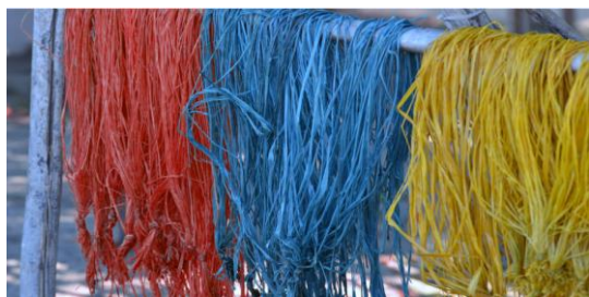
Figure 1 – Fibres de raphia teintées avec de l' A. excelsus (rouge), I. tinctoria (bleue), H. madagascariensis (jaune)

Les problèmes environnementaux et toxicologiques liés aux colorants issus de la synthèse chimique ont ravivé le besoin de trouver des solutions naturelles alternatives aux colorants artificiels [1,2]. Dans une optique de remplacement des colorants artificiels par des colorants naturels issus de ressources renouvelables, la production de pigments végétaux et/ou microbiens devrait voir sa croissance augmenter de manière significative dans les prochaines années. Dans le règne végétal, parmi les nombreuses plantes productrices de pigments, la biodiversité végétale tinctoriale de Madagascar peut constituer de précieuses matières premières naturelles pour l'industrie des colorants naturels. Le savoir-faire artisanal pour l'utilisation de certaines plantes pour la teinture de fibres naturelles, comme la teinture du raphia par des extraits d' A. excelsus , de H. madagascariensis ou de Indigofera tinctoria (Figure 1) est très riche dans certaines régions de Madagascar (Majunga...). Ce savoir-faire ancestral s'est transmis de génération en génération.